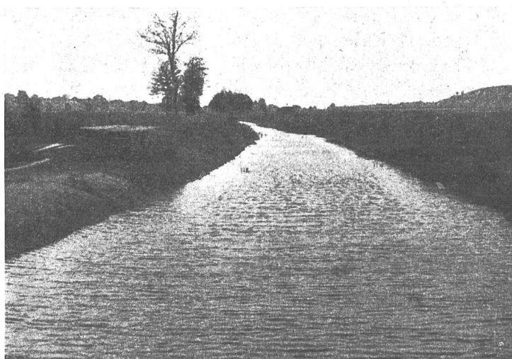
Abb. 27 Aufstau im Kanal Süd

In hydraulischer Hinsicht wurden durch die vorbeschriebenen Anlagen die Verhältnisse in zufriedenstellender Art geordnet. Aber es ist damit noch nicht alles erreicht. Es zeichnet sich ein weiteres Problem deutlich ab, und dieses besteht in der Schaffung des notwendigen Windschutzes. Auch hier ist bei richtiger Zusammenarbeit die Lösung möglich durch Anlage eines Wegnetzes senkrecht zur Windrichtung und Baumpflanzung auf der Ostseite dieser Wege. Dies ist oft nur durchführbar in Verbindung mit der Güterzusammenlegung, die weitere grosse Vorteile bringen würde. Es handelt sich um grosse Änderungen; aber die Bevölkerung hat aus dem frühern Sumpf ein hochwertiges Kulturgebiet geschaffen und wird es weiter verbessern. Die Einsicht ist da, und die Jungen werden auch Mittel und Wege finden, um das erkannte Ziel zu erreichen.