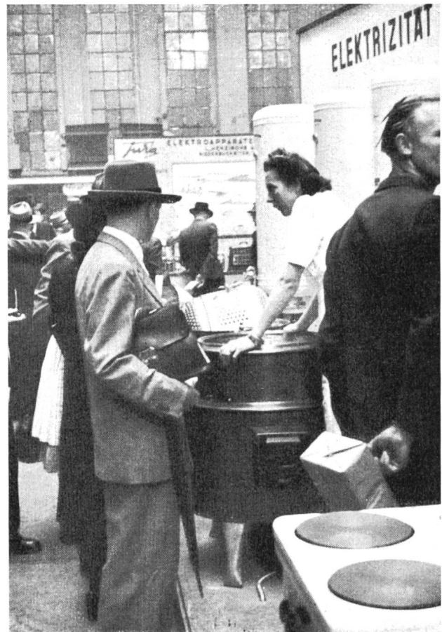
Fig. 12 Waschmaschinenberatung am Kollektivstand.

gendes Arbeiten solcher Maschinen erzielbar sein. Ein Anfang ist gemacht, und es ist zu hoffen, dass die Elektrizität auch auf diesem Gebiet der Hausfrau die Verrichtung ihrer täglichen Arbeiten wird erleichtern helfen.