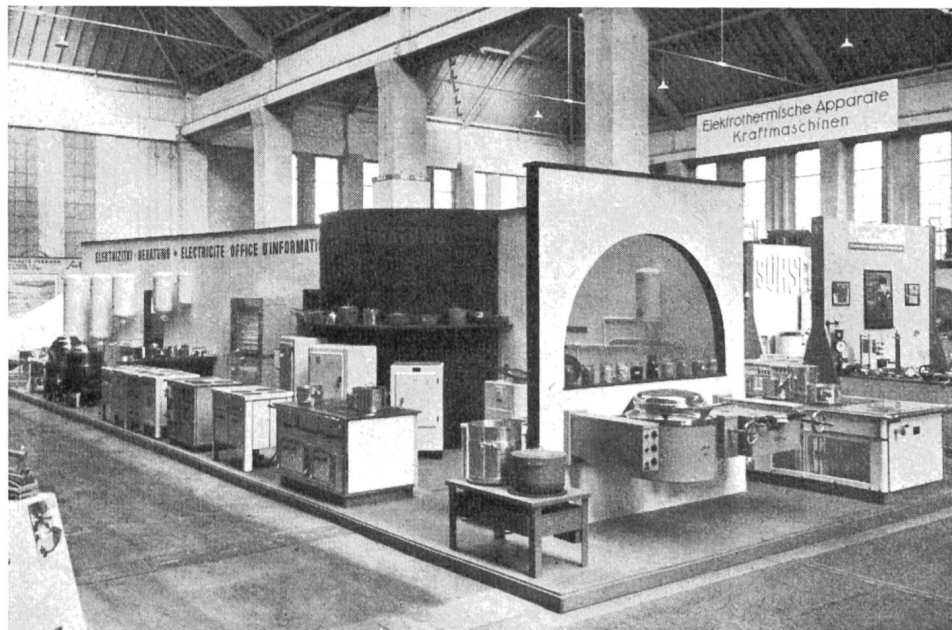
Fig. 9 Kollektivstand der Elektrowirtschaft an der Mustermesse 1946. Vorderseite mit Haushaltapparaten.

Auffallend grosses Interesse herrschte gegenüber elektrischen Maschinen, Apparaten und für Installationsmaterial. Wie bereits in früheren Jahren, präsentierte sich die Abteilung «Elektrizität» wiederum in der Halle V, woselbst sie sich zufolge besonders geschmackvoller Gestaltung der Messestände als äusserst wirkungsvoll erwies. Inmitten dieser Abteilung hatte die Elektrowirtschaft in Zusammenarbeit mit einigen nordwestschweizerischen Elektrizitätswerken abermals ihren gewohnten Kollektivstand aufgebaut. Dieser Stand stellt sich zur Aufgabe, Interessenten aus der Industrie, aus Gewerkekreisen und aus dem Haushalt beratend zur Seite zu stehen. Dieser Auskunftsdienst hat sich bereits so gut eingebürgert und bewährt, dass er sich aus dem Rahmen der Schweizer Mustermesse überhaupt nicht mehr wegdenken lässt. Weit ausser die grösste Zahl der Standbesucher legt Wert darauf, von unparteiischer Seite Auskunft zu erhalten über Anschlussmöglichkeiten, Betriebs-