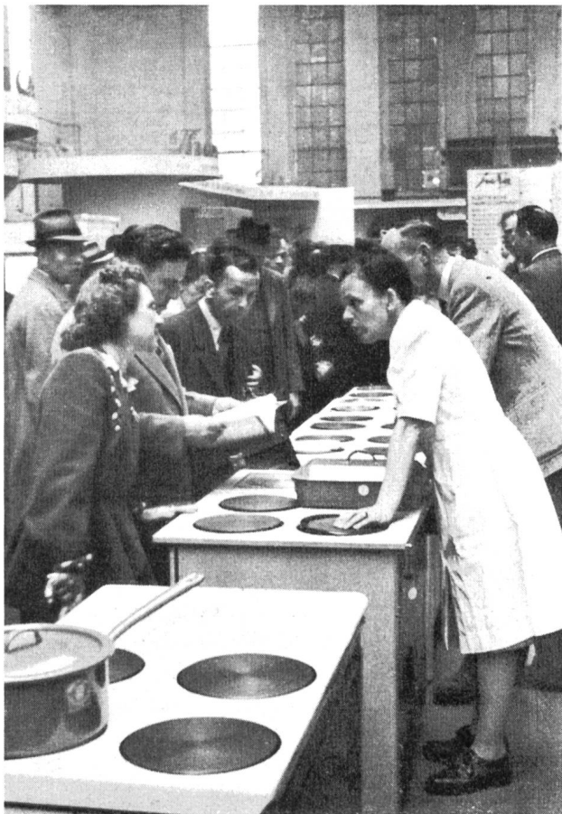
Fig. 11 Bei den elektrischen Haushaltherden war der Andrang immer gross.