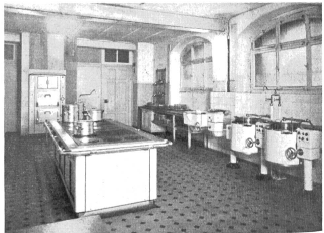
Fig. 3 Der Herd, die beiden Kippkessel, die Kippbratpfanne und im Hintergrund der Brat- und Backofen.