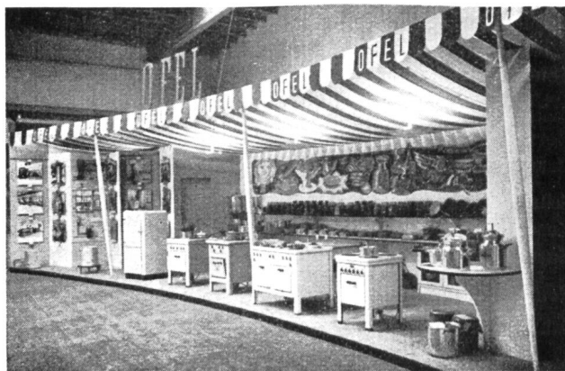
Fig. 44 Le stand des démonstrations de séchage et stérilisation des fruits et légumes au four électrique.

exposition de caractère entièrement nouveau et qui a remporté les suffrages unanimes. En principe, cette exposition comprenait trois divisions. La première était consacrée aux applications ménagères représentées par des figurines placées sur un carrousel et symbolisant la lumière, la force, le froid, la cuisson et l'hygiène. La seconde division, de caractère essentiellement pratique, s'adressait aux ménagères qui, toujours plus nombreuses, s'intéressent à la stérilisation et au séchage des fruits et légumes au four électrique; les démonstrations avaient été confiées