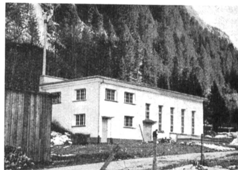
Abb. 10 Kraftwerk Tagenstal, Ansicht der Zentrale.