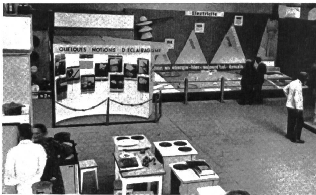
Fig. 86 Les stands de l'OFEL, Office d'Electricité de la Suisse romande, au Comptoir Suisse de 1942.

Dans l'ensemble, tous les stands de l'électricité ont été très achalandés et jamais le nombre des visiteurs n'y fut aussi considérable.