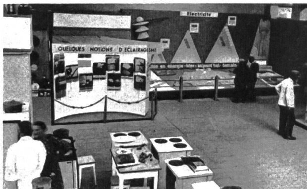
Fig. 86 Les stands de l'OFEL, Office d'Electricité de la Suisse romande, au Comptoir Suisse de 1942.

Dans l'ensemble, tous les stands de l'électricité ont été très achalandés et jamais le nombre des visiteurs n'y fut aussi considérable.