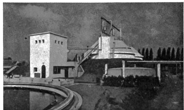
Abb. 10 Moderne biologische Abwasserreinigungsanlage in Bussum (Antwerpener Gemeindewerke).

Niedere Bauwerke, wie Sandfänge, Absetzbecken, Tropfkörper, Nachklärbecken usw. können leicht in jeder Gegend eingerichtet werden, ohne mit den Interessen des Heimatschutzes in Konflikt zu geraten. Dass aber auch hohe Faulräume mit Gebäuden für Maschinen und elektrische Apparate so projektiert und gebaut werden können, dass unter Zuhilfenahme einer zweckmässigen Bepflanzung keinerlei Verunstaltungen des Landschaftsbildes entstehen, zeigt deutlich Abb. 10, ein Blick auf das Absetzbecken, die beiden Faulräume, das Maschinenhaus und den Gasbehälter einer Kläranlage für eine Stadt mittlerer Grösse in Holland.