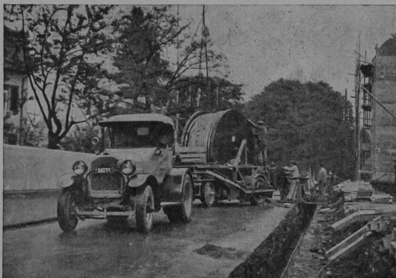
Verlegung von 6-kV-Kabeln 3 \times 240 \text{ mm}^2 für das Elektrizitätswerk der Stadt Bern.