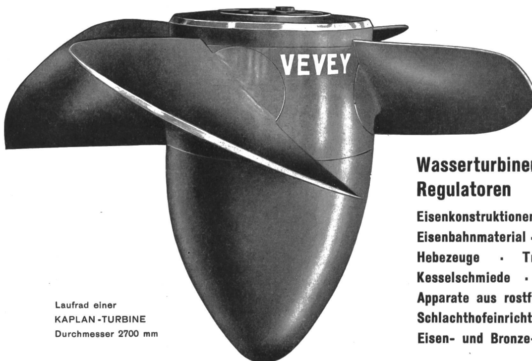
Lauftrad einer KAPLAN-TURBINE Durchmesser 2700 mm