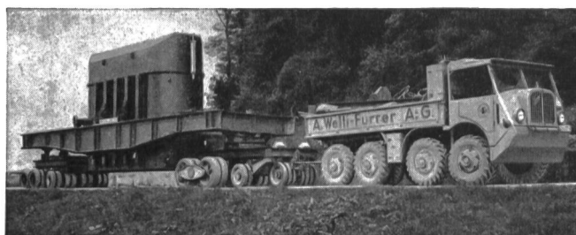
Transport eines Transformators von über 70 Tonnen Gewicht