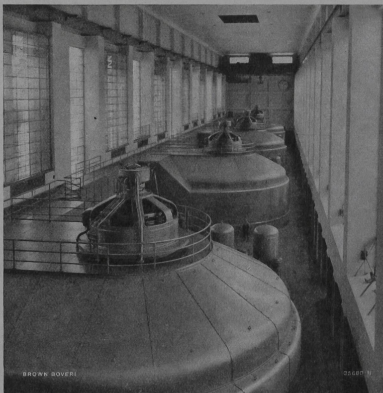
4 Dreiphasen-Generatoren des Rheinkraftwerkes Ryburg-Schwörstadt

Technische Bureaux in Baden, Basel, Bern und Lausanne