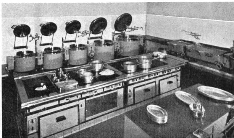
Fig. 21 Kochherd, Kippkessel- und Bratpfannengruppe. Cuisinière électrique, poste des marmites basculantes et les poêles à frire.

Die Verwaltung des Volkshauses hat in verdankenswerter Weise einige statistische Angaben über den Essen-Umsatz, die Einnahmen aus warmer