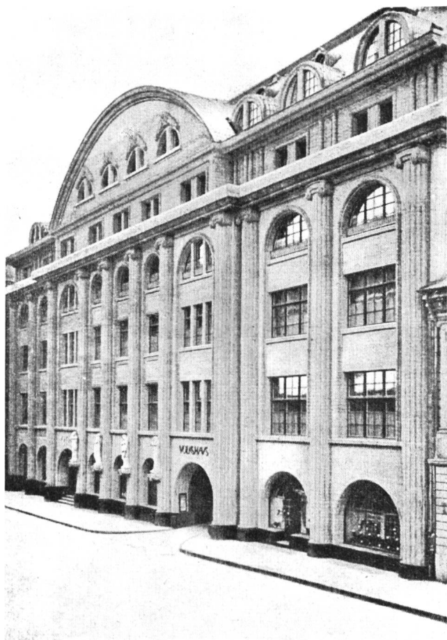
Fig. 19 Aussenansicht des Hotel-Restaurant Volkshaus, Bern. Vue générale de l'hôtel-restaurant «Volkshaus» à Berne.

Mit der neuen elektrischen Kocheinrichtung besitzt das Etablissement eine moderne Grossanlage, die den höchsten Anforderungen gewachsen ist. Die bisherigen Erfahrungen sind in allen Teilen sehr zufriedenstellend. Stossbetriebe können mit der neuen Einrichtung reibungslos bewältigt werden. Die bisher grösste Spitzenleistung war der Neujahrstag 1940, an dem 1420 Essen (780 Mittag- und 640 Nachtessen) serviert worden sind. In diesen Zahlen ist das ebenfalls verpflegte Personal (85 Personen) nicht inbegriffen. Die bisher höchste Belastung der Kochanlage betrug 119 kW (Viertelstundenmittel-