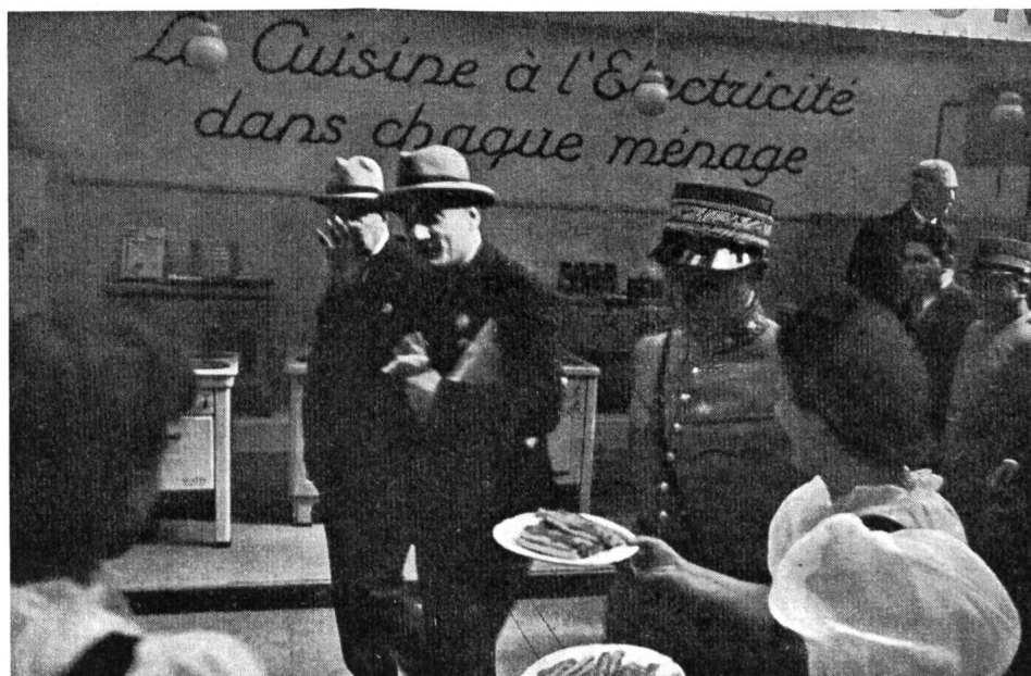
Fig. 22 Le Général Guisan et M. Pilet-Golaz, Président de la Confédération, visitent les stands de l'électricité.

Le stand de l'Office d'Electricité de la Suisse romande (OFEL) s'était spécialisé dans les démonstrations de séchage et de stérilisation des fruits et des légumes dans le four de la cuisinière électrique.