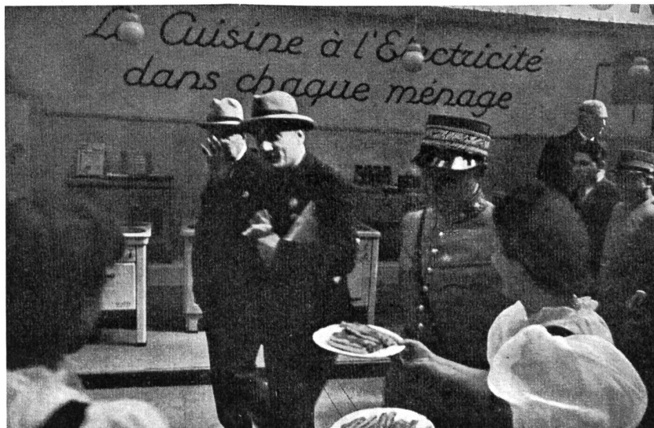
Fig. 22 Le Général Guisan et M. Pilet-Golaz, Président de la Confédération, visitent les stands de l'électricité.

Le stand de l'Office d'Electricité de la Suisse romande (OFEL) s'était spécialisé dans les démonstrations de séchage et de stérilisation des fruits et des légumes dans le four de la cuisinière électrique.