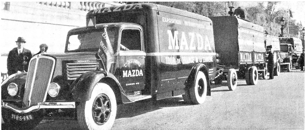
Fig. 3 Lichtwagengruppe der «Tour de France de la lumière».