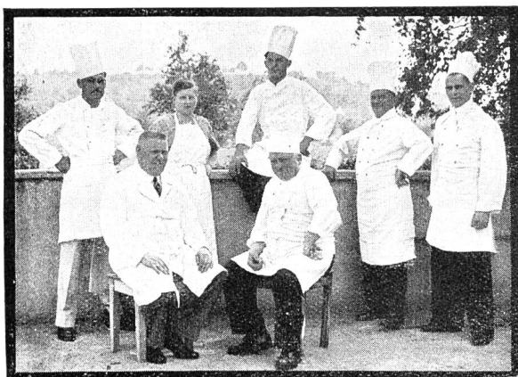
Die elektrische Küche im Flugplatz-Restaurant Dübendorf.

„Ich fühle mich veranlasst, Ihnen mitzuteilen, dass die im Jahre 1932 gelieferte elektrische Grossküchenanlage seit Bestehen ausgezeichnet funktioniert hat. Anlässlich des letzten Flugmeetings vom 23. Juli bis 1. August 1937 hatte die Küche einen gewaltigen Stossbetrieb zu bewältigen. Es wurden in dieser Zeit 2815 komplette Diners und warme Platten und 1035 Soupers und warme Platten serviert. Während des ganzen forcierten Betriebes hat sich nicht die geringste Störung gezeigt, und ich kann allen meinen Kollegen eine elektrische Therna-Grossküchenanlage aus den gemachten Erfahrungen nur bestens empfehlen.“