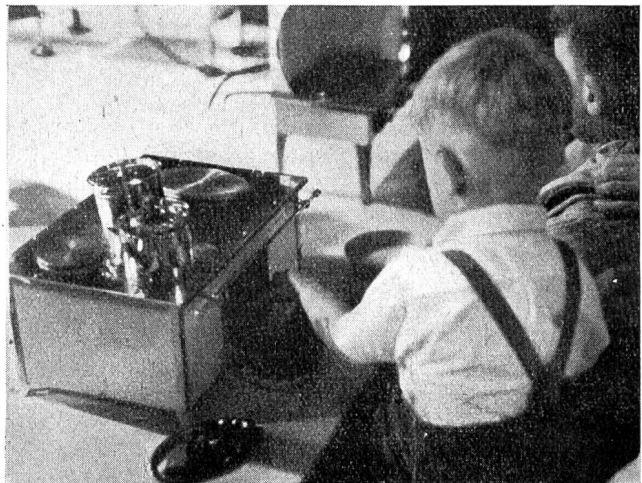
Fig. 5 Bereits im Jahre 1935 fand in Essen, im Rahmen einer Elektrowärme-Tagung des R. W. E., vom 22. bis 29. Mai eine «Elektrowoche» statt, die einen recht guten Erfolg verzeichnete. Bild links: Werbewagen der Essener Strassenbahn für die «Elektrowoche». Bild rechts: Elektrische Kinderküche an der Elektrowärmeausstellung. «Semaine de l'électricité», organisée en 1935, à Essen, dans le cadre d'un Congrès d'électrothermie du R. W. E. A gauche: une voiture de propagande des tramways municipaux. A droite: une cuisinière électrique pour enfants à l'exposition des applications électrothermiques.