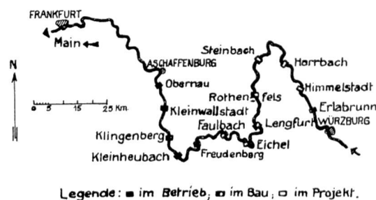
Abb. 3 Uebersichtsplan der Mainkanalisierung Aschaffenburg-Würzburg

Der Main soll durch diese Arbeiten zur Grossschiffahrtsstrasse für den 1500-Tonnen-Schleppkahn ausgebildet werden. Der Schiffsanagenweg wird dabei ohne Ausnahme im alten Flussbett belassen, dessen Minimalkrümmung mit einigen