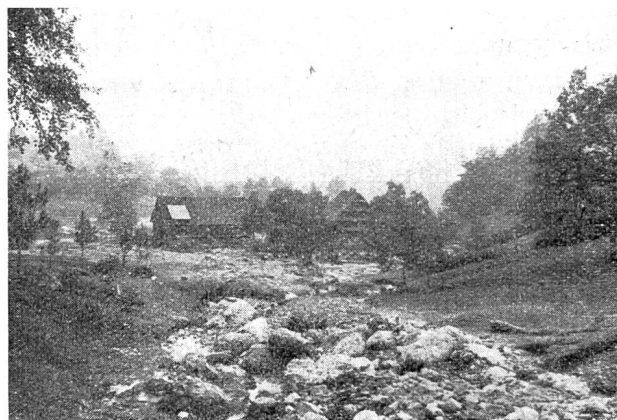
Abb. 5. Brüschrach bei Sattel.

Der Schluß des Berichtes enthält eine Aufstellung der angenäherten Kosten der Verbauungen, für die neue Kredite geschaffen werden müssen. Es handelt sich um eine Summe von 2,75 Mio. Fr., die für die Wiederherstellung