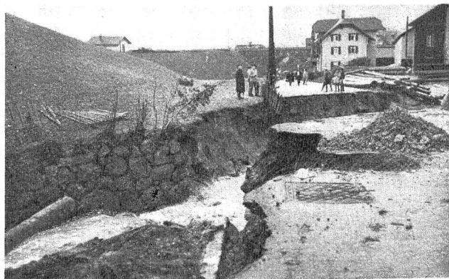
Abb. 3. Rigi-Aa und Kantonsstraße in Goldau.