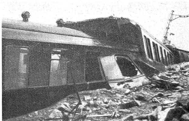
Abb. 1. Zug der SBB in der Rufe des Langweidbaches.