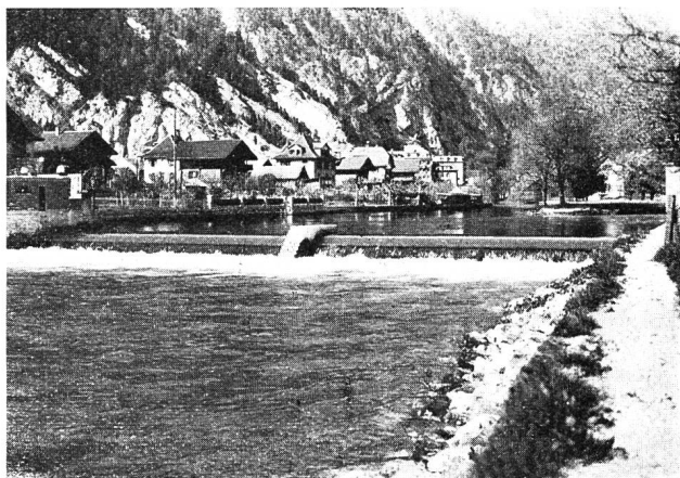
Elektrizitätswerk Interlaken. Dachwehr in der Aare zwischen Briener- und Thunersee.

Tiefbauarbeiten unter dessen Leitung durch ortsansässige Werkstätten und Unternehmer. Mit den Bauarbeiten wurde am 1. Dezember 1931 begonnen und Ende März 1932 konnte das Dachwehr in Betrieb genommen werden.