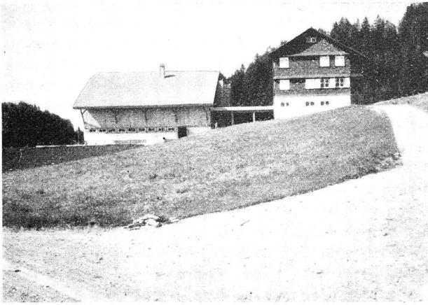
Abb. 7. Neue Ansiedlung auf der Egger Allmeind (Sulztal)

gruppe im Altberg, wo die Ansiedler vorausvertraglich sich für die Uebernahme der Ansiedlungen erklärt hatten, machte sich die Baugesinnung in der Weise geltend, daß die örtlich hergebrachten Bauformen sozusagen in ihrem ganzen Umfange, auch mit Bezug auf Einzelheiten gewürdigt werden sollten. Es hat indessen den Anschein, daß die Interessenten bei den später auszuführenden Siedlungen wieder die anfänglich aufgebrachten Bautypen beachten wollen. Eines wird von der Bauleitung fortgesetzt vermehrt beachtet: die Baukosten mit der sinkenden landwirtschaftlichen Konjunktur in Uebereinstimmung zu behalten. Die Nettoübernahmepreise der bisher errichteten Ansiedlungen halten sich durchaus im Rahmen der heute gültigen Ertragswertnormen.