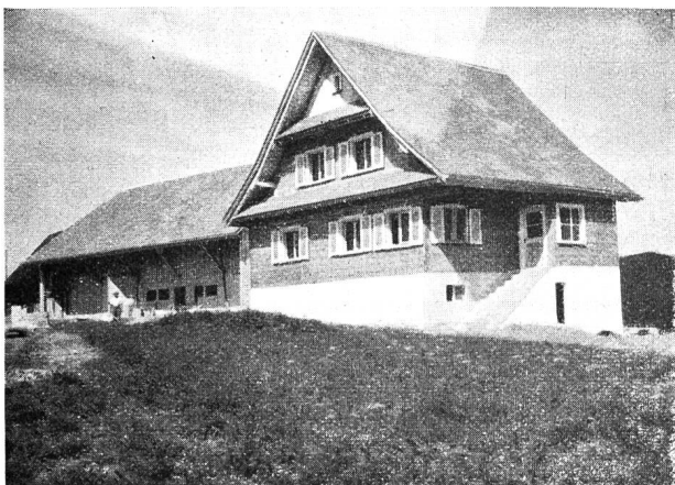
Abb. 8. Neue Ansiedlung im Altberg.

Der Stand des Umsiedlungswerkes ist heute so, daß vier Ansiedlungen im Sulztal, je eine in Egg und im Steinbach vollendet und bezogen sind. Die zweite Siedlungsgruppe im Altberg (neun Siedlungen) steht unmittelbar vor der Fertigstellung. Für die dritte Siedlungsgruppe im Waldweggebiet (acht Siedlungen), die in den nächsten Wochen in Angriff genommen wer-