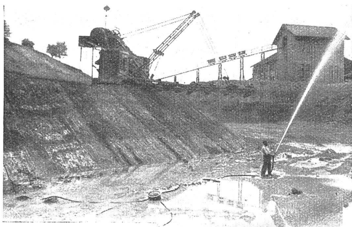
Elektrische Schwimmpumpe im Betrieb in einem Dachziegelwerk.

Die elektrische Schwimmpumpe. Die elektrische Schwimmpumpe, System Hallwig, ist selbstansaugend und kann zur Be- und Entwässerung jeder Art Flüssigkeit bis zu 50° C Wärme verwendet werden. Der Maschinensatz wird von einer wasserdichten, mit Luft gefüllten Schwimmboje umschlossen. Die Pumpe kann Wasser und andere Flüssigkeiten schöpfen, ohne durch feste Montage an einen festen Ort gebunden zu sein.