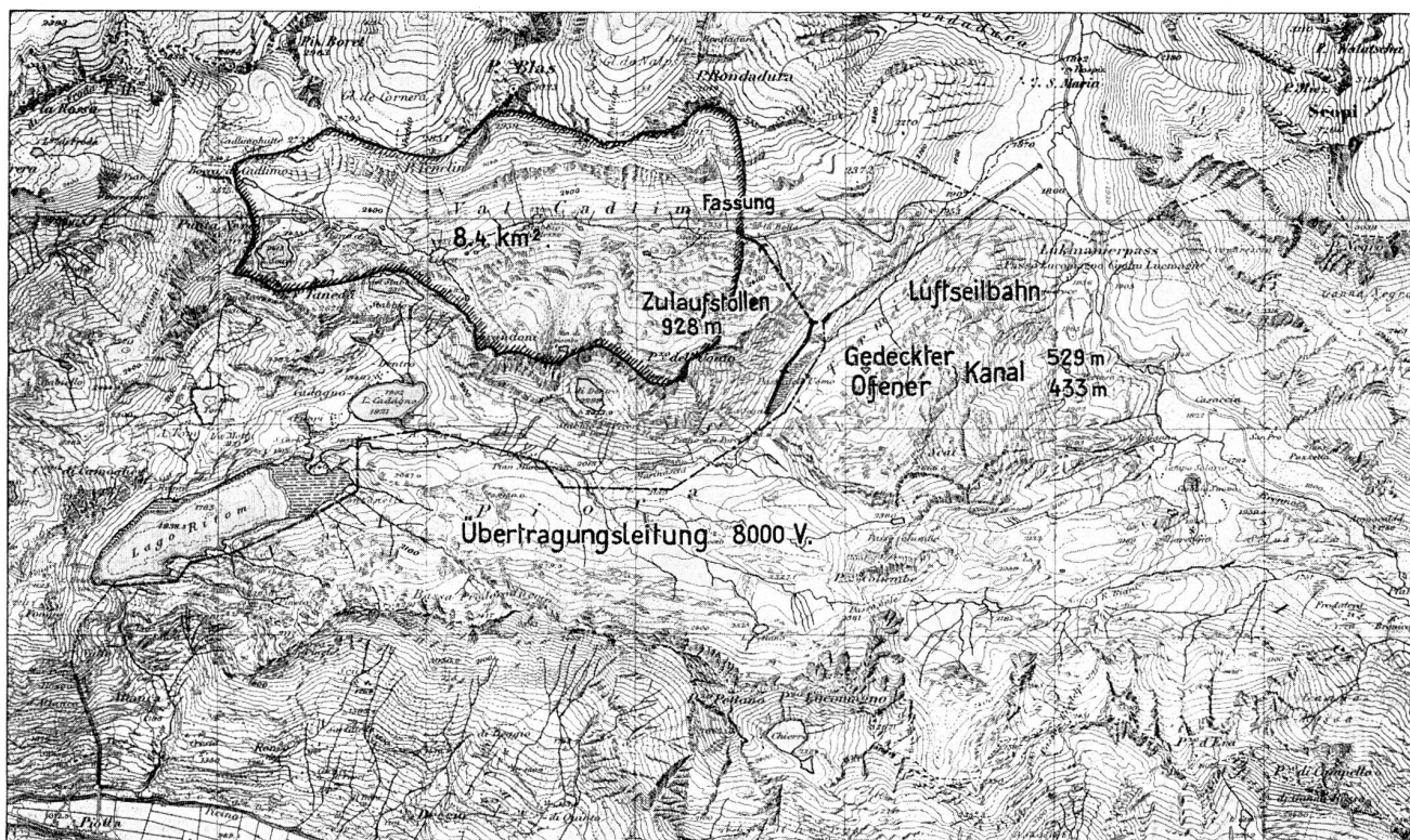
Abb. 1. Uebersichtsplan des Einzugsgebietes des Ritomsees mit dessen Erweiterung durch Ueberleitung des Cadlimobaches. Maßstab: 1 : 75 000.

dies dem Kanton Tessin zusteht, das Wasser der Val Cadlimo (Medelser-Rhein) über den Passo dell'Uomo in das Pioratal einzuleiten und so die zu gewinnende Wasserkraft mit derjenigen des Ritomsees zu kumulieren (Abb. 1). Da jedoch durch die Ableitung des Cadlimobaches aus dem Flußgebiet des Rheins in dasjenige des Tessin dem Mittelrhein Wasser entzogen wird, haben die SBB als Rechtsnachfolger der Leventina-Konzession im weitem mit den verleihungsberechtigten Bündner Gemeinden Medels und Disentis einen Vertrag über das Recht der provisorischen Ueberleitung des Cadlimobaches in den Ritomsee abgeschlossen, der am 1. August 1929 vom Kleinen Rat des Kantons Graubünden genehmigt wurde. Unter grundsätzlicher Anerkennung des Rechtes der Verleihungsgemeinden und des Kantons Graubünden auf den gesamten Wasserabfluß der Val Cadlimo ab der tessinisch-graubündnerischen Grenze sieht der Vertrag die Ableitung von 0,635 m 3 /sek. im Jahresmittel vor und zwar auf die Dauer von 20 Jahren, d. h. bis zum 31. Dezember 1950. Wird die Bewilligung von keiner der Parteien 2 Jahre voraus gekündigt, so läuft sie jeweils auf 5 Jahre weiter. Eine längere Frist für die Ableitung des Wassers war nicht erhältlich, weil ein Projekt für die Ausnützung des Vorder- und Mittelrheins mit Akkumulieranlagen in Santa Maria und im Val Nalps besteht, zu deren Auffüllung das Wasser des Cadlimobaches benötigt wird. In der Annahme, daß dieses Projekt kaum vor 20 Jahren zur Ver-