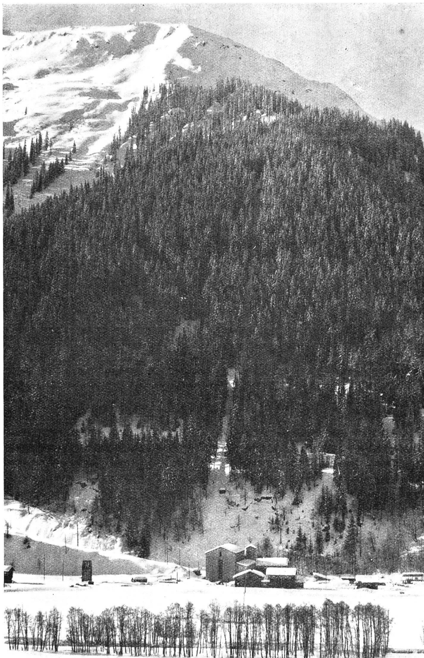
Abb. 36. Klosters. Ansicht der Zentrale und Druckleitungs-Tracé.

ersten Ausbau 15,000,000 kWh, bei vollständigem Ausbau 25,000,000 kWh.