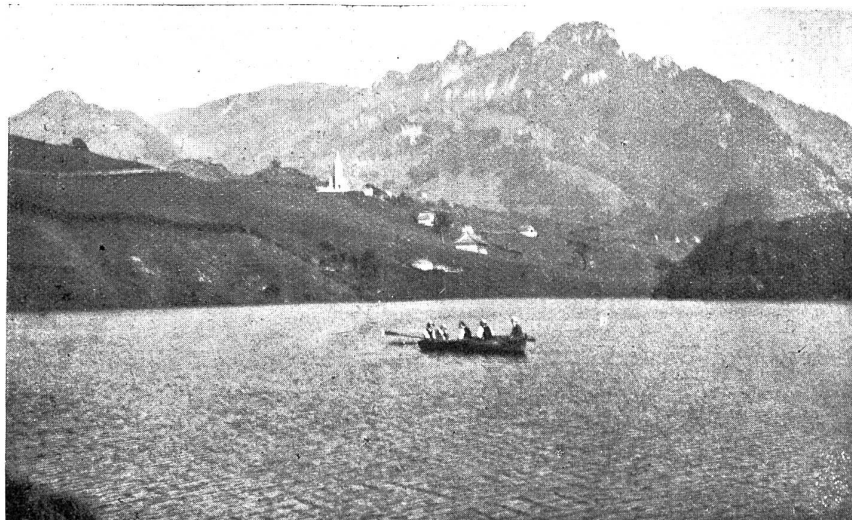
Abb. 2. Elektrizitätswerk Broc. Charmey und der Lac de Montsalvens.