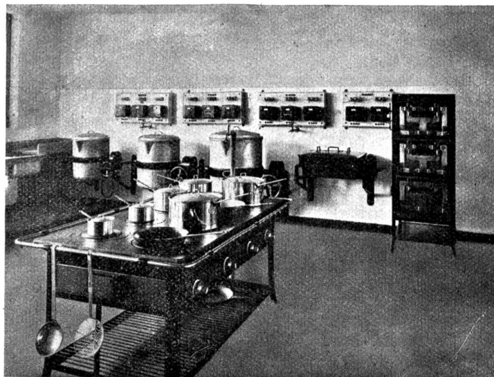
Elektrische Grossküchenanlage, ausgeführt von der Firma Salvis, Emmenbrücke, für die Viscosegesellschaft in Emmenbrücke. Im Vordergrund der Gross-Kochherd, an der Wand ein dreistöckiger Brat- und Backofen, links drei Kippkessel.

Eine für die Grossküche unentbehrliche Einrichtung ist die elektrische Warmwasseranlage. Diese muss so reichlich bemessen sein, dass sie zu jeder Zeit imstande ist, heisses oder doch vorgewärmtes Wasser für Koch- und Reinigungszwecke zu liefern. Für Grossküchen kommen nur Speicher für direkten Anschluss oder in Verbindung mit Schwimmergefäss in Frage. Der innere Kessel besteht aus verzinktem Schmiedeisenblech und ist vorschriftsgemäss für den Betriebsdruck geprüft. Sämtliche Apparate sind mit einer vollkommenen Wärmeisolation versehen, wodurch die Wärmeverluste auf ein Minimum reduziert werden, sodass die Temperatur des Wassers von 90° Celsius in 24 Stunden ohne Stromzufuhr nur um einige Grade sinkt. Die Regulierung der Speicher erfolgt in den meisten Fällen automatisch, in der Weise, dass die erwünschte Wassertemperatur mit Hilfe eines Thermoelementes eingestellt werden kann, das nach ihrer Erreichung die Strom-