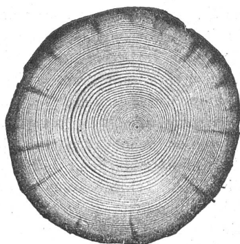
Abb. 2. Querschnitt von im Eintauchverfahren imprägnierter (Myanisierter) Rundhölzer.