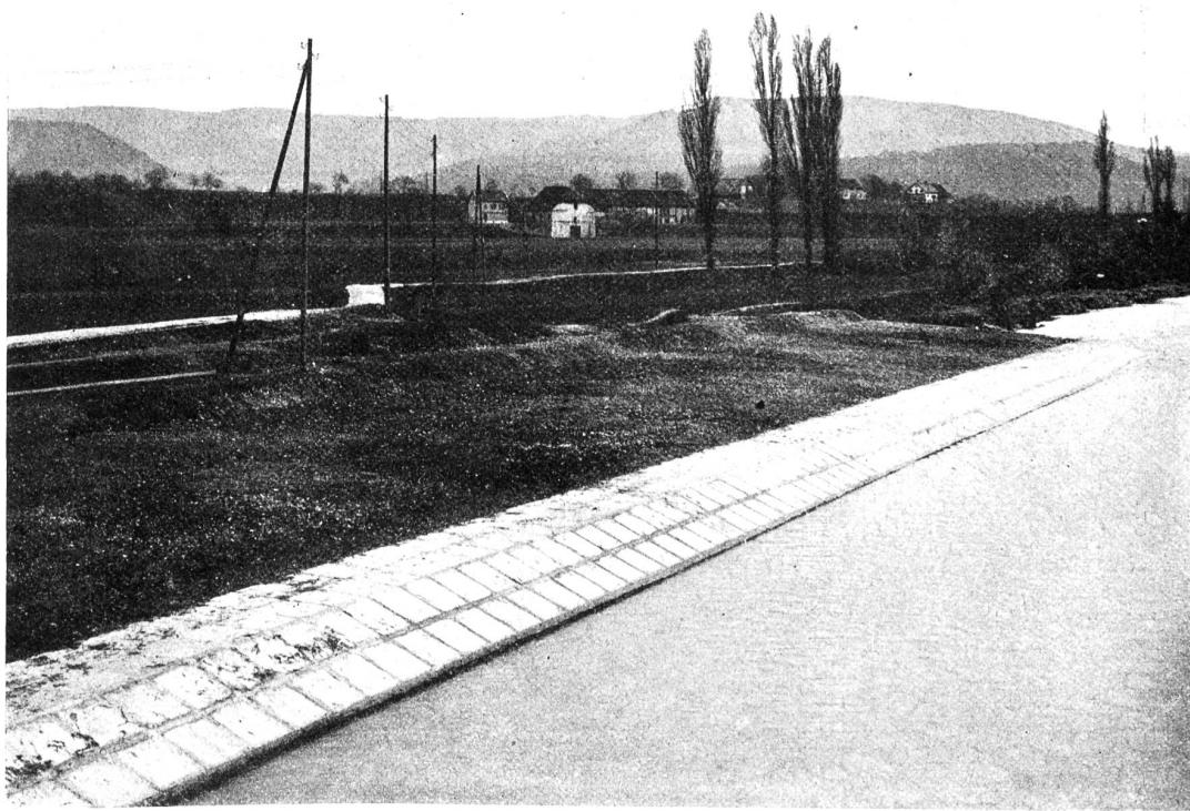
Uferschutzarbeiten. Abbildung 4. Birsuferverbauung Birsfelden, ausgeführt 1911.

Die bis jetzt am meisten zur Verwendung gekommenen Platten haben Seitenlängen von 100 auf 100 cm, oder 120 cm Länge und 80 cm Höhe. Die Dicke beträgt 6—7 cm. Ausser der Eisenarmierung in der Höhenrichtung erhalten sie auch in der Längsrichtung durchgehende Eisenstäbe, die an den Schmalseiten ringförmig umgebogen sind. Sie laufen nicht ganz horizontal, sondern sind etwas geneigt, so dass beim Aneinanderfügen die Ringe der Nachbarplatte darunter zu liegen kommen. Dadurch wird das Zusammensetzen der Platten in gleichlaufendem Gefälle der Sohle und der Oberkante möglich, indem die angrenzenden Seitenflächen bis auf die äusseren Durchmesser der Ringe aneinander geschoben wer-