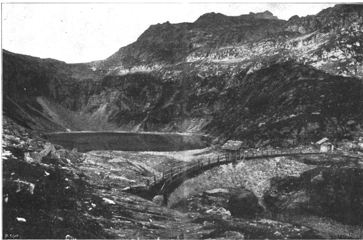
Abbildung 3. Chironico-See mit Stauanlage.

Vertreter der Behörden, der technischen Vereine, der mitwirkenden Firmen, befreundete Ingenieure und Techniker aus der Schweiz und Oberitalien, Vertreter der Presse, die Mitarbeiter des Werkes selbst, bei prächtigem, mit Wärme reichlich gesegnetem Wetter vor. Ein Extrazug führte am Sonntag morgen die Gesellschaft von Bellinzona talaufwärts bis Bodio und hier auf dem von der Gesellschaft „Motor“ angelegten Industriegeleise bis dicht an das Maschinenhaus, ein in gefälliger, der Landschaft gut angepassten Gebäude (Abbildung 2). Hier endigt die doppelte Druckleitung; jedes Leitungsrohr speist zwei Turbinen mit vertikaler Welle von je 10,000 P.S. Das Maschinenhaus ist somit für eine Gesamtleistung von 40,000 P.S. eingerichtet. Indessen sind gegenwärtig nur 30,000 installiert (drei Generatoren zu 7000 Kilowatt). Die Turbinen sind mit Dreiphasengeneratoren von 8000 Volt, 50 Perioden, direkt gekuppelt; die Erregermaschinen sind auf die Generatoren gesetzt. Das aus den Turbinen abfließende Wasser wird von einem Sammelkanal aufgenommen und durch einen 550 Meter langen, eingesnittenen Unterwasserkanal wieder dem Tessin zugeleitet.