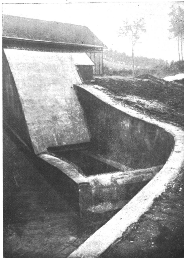
Die Wasserwerkanlage Siegesmühle bei Seon. Abbildung 4. Saugüberfall, von unten gesehen.

Auf österreichischer Seite hatte 1830 die Situation mit einem Schlage sich für die schwer belasteten Gemeinden aufgehellt. Dieses Jahr brachte dem Lande das sogenannte „Wasserbau-Normale“, in dem a priori festgestellt und ausgesprochen wurde, dass die Grenzflüsse auf Kosten des Staates einzuhalten seien. Mit diesen wenigen Worten war für Vorarlberg unerwartet und ohne alle Ablösung die ganze Wuhrübernahme ausgesprochen und bewerkstelligt worden. Die Gemeinden, welche zu „Wuhrkonkurrenzen“ vereinigt wurden, hatten nur noch beschränkte Leistungen zu machen, entsprechend dem Mehr, das nicht nur für die Erhaltung des Flusslaufes, sondern für ihre eigenen Interessen erforderlich war.