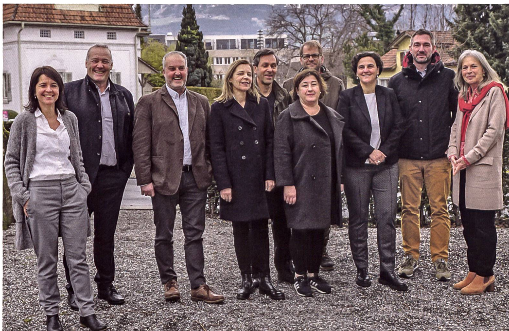
17.04.2023: Der Verein Südkultur will die regionale Anbindung stärken.