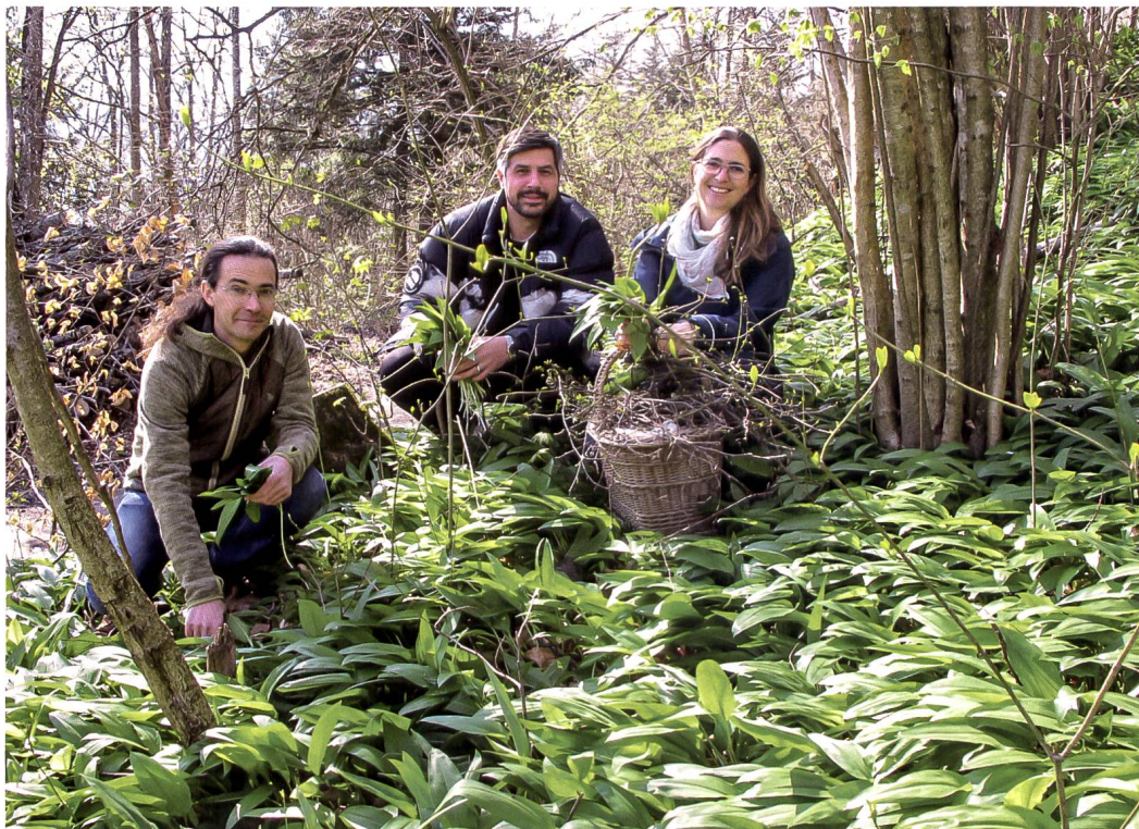
16.04.2023: Ein essbares Werdenberg wird erschaffen.