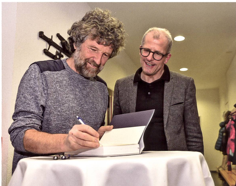
02.04.2023: Neues Werdenberg-Buch: Grosse Momente, kleine Schicksale.