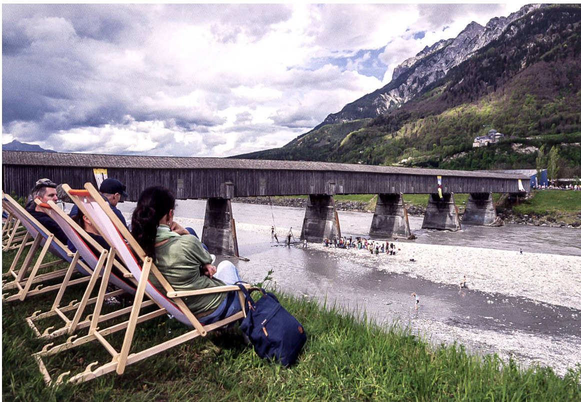
29.04.2023: Die alte Rheinbrücke Sevelen-Vaduz als verbindendes Element und Kunstplattform zu den Feierlichkeiten 100 Jahre Zollvertrag.

36 Fahrzeuge kontrolliert. In zwanzig Fällen ersetzen sie defekte Leuchtmittel während an sechs Fahrzeugen die Leuchteinheit korrekt eingestellt wird. Die Betroffenen bezahlen lediglich die Materialkosten. 14.12.2022