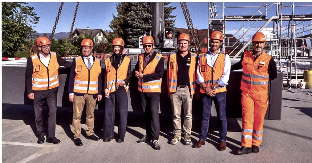
19.10.2022: Mit dem symbolischen Spatenstich wurden die «Weichen für die Zukunft gestellt».

land ihrerseits haben der Fusion ebenfalls zugestimmt. Auch in Pfäfers stimmen die Delegierten aus den Musikvereinen Vätis, Pfäfers, Bad Ragaz, Vilters, Wangs, Sargans, Mels, Flums, Walenstadt, Mols, Murg und Quarten diesem Antrag einstimmig zu. Dadurch umfasst der neue Kreis Sarganserland Werdenberg neu über 600 Mitglieder. Als erstes grosses Fest steht dem neu fusionierten Kreis am 17. Juni 2023 der Kreismusiktag Buchs ins Haus.