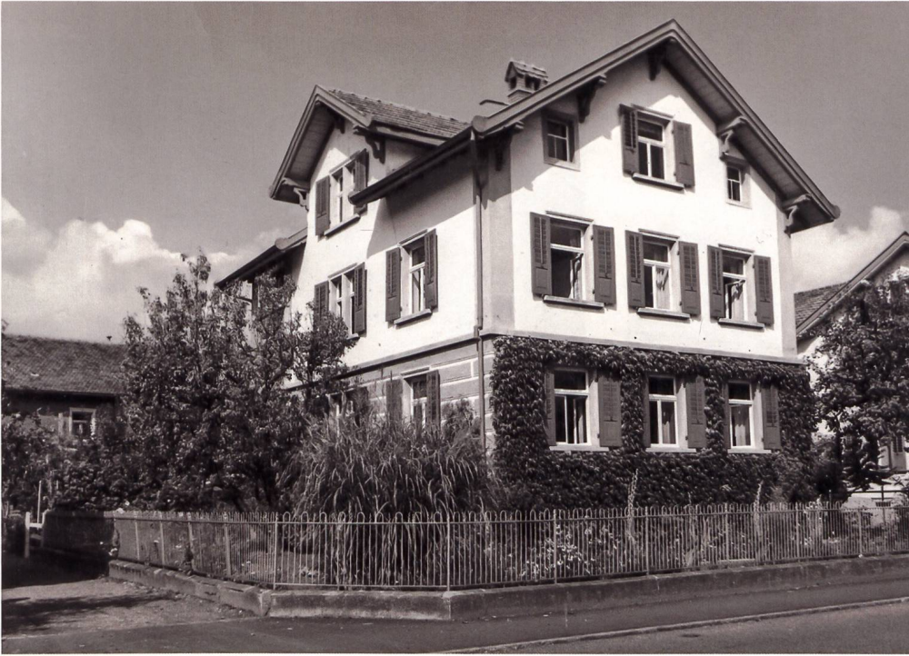
Ellas Elternhaus an der Kappelstrasse in Buchs, wo sie bis kurz vor ihrem Tod lebte (Aufnahme von 1959).