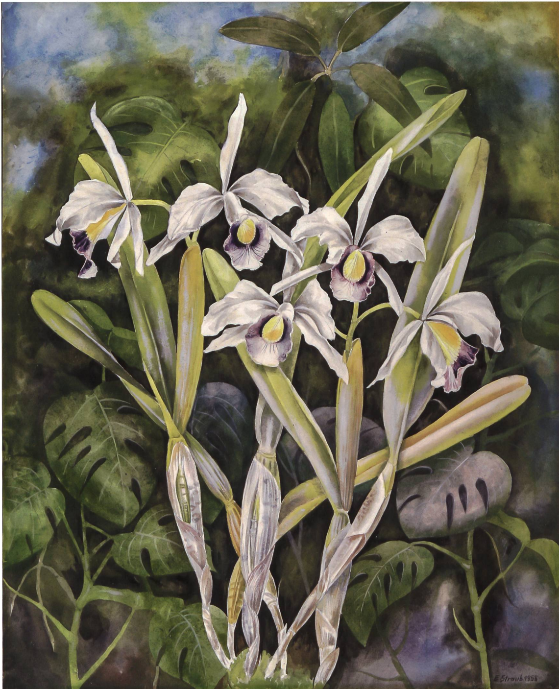
Blumenstilleben mit Orchideen, Gemälde von Ella Straub aus dem Jahr 1958.