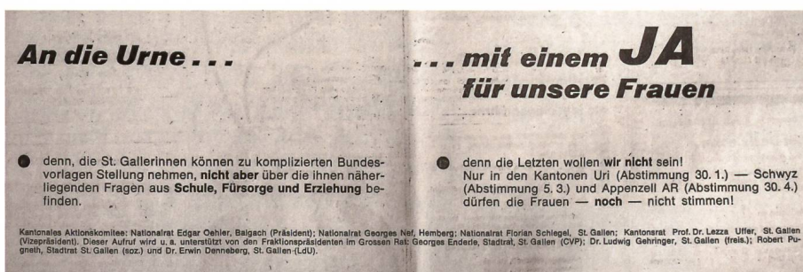
Politiker unterschiedlicher Parteien warben am 22. Januar 1972 für ein Ja zum Frauenstimm- und -wahlrecht auf kantonaler Ebene.

Mit der Einführung des Frauenstimm- und -wahlrechts am 7. Februar 1971 standen die meisten Kantone vor der Aufgabe, die politische Gleichberechtigung der Frau auch auf kantonaler Ebene einzuführen. Im Kanton St. Gallen wurde diese Volksabstimmung auf den 23. Januar 1972 angesetzt.