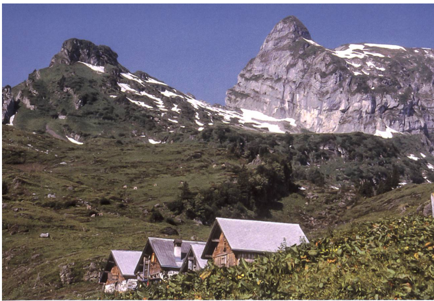
Das Alt-Hütte-Zimmer auf der Alp Ischlawitz, 1994.