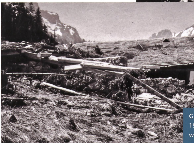
Das durch eine Staublawine zerstörte Tüeren-Zimmer auf der Alp Ischlawitz 1973.

Das später abgebrannte Galfer-Zimmer im Sommerbetrieb auf der Alp Ischlawitz vor 1964.