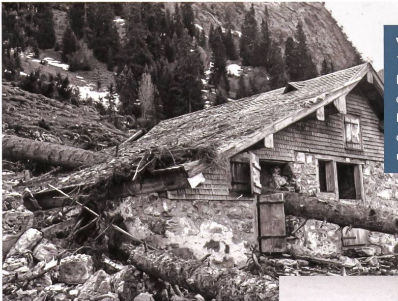
Zerstörter Inggernascht-Schopf in der Voralp 1951.