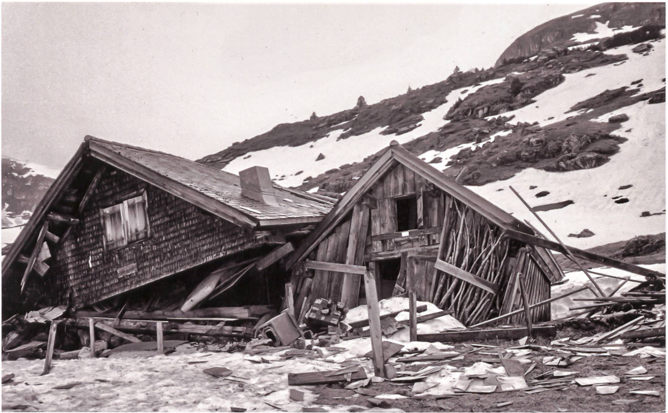
Das zerstörte Alt-Hütte-Zimmer im Frühling 1999.