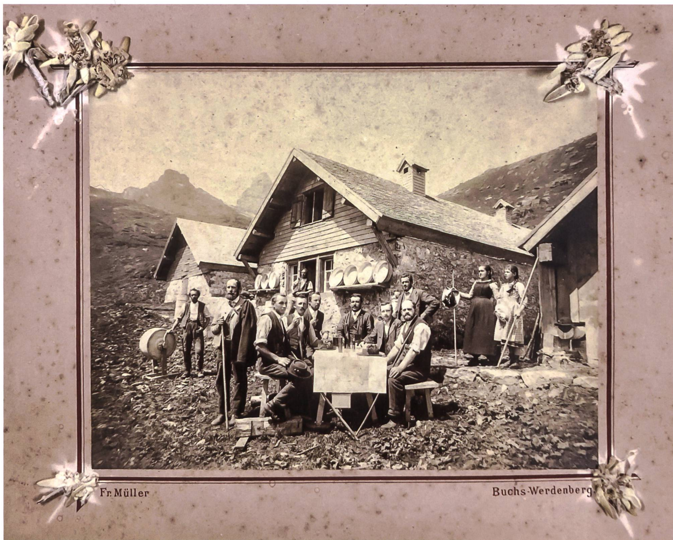
Das Alt-Hütte-Zimmer von 1893 auf der Alp Ischlawitz.

ten und grösstenteils neu erstellten Gebäude «gehörig» auf das Bild kamen. Dies deutet darauf hin, dass man explizit das neu erstellte Alpzimmer fotografisch festhalten wollte. Damit hat der Buchser Fotograf Friedrich Müller das wohl älteste Foto eines Grabser Alpzimmers geschossen.