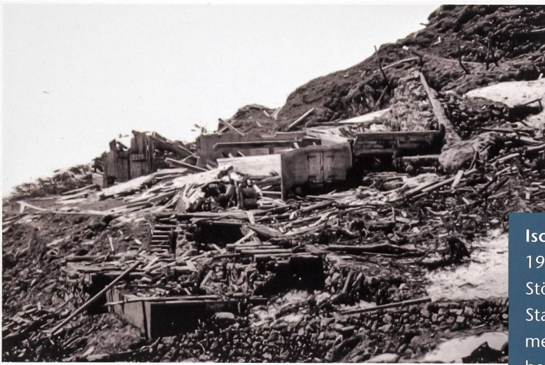
Das durch eine Staublawine zerstörte Stögg-Zimmer auf der Alp Ischlawitz 1973.