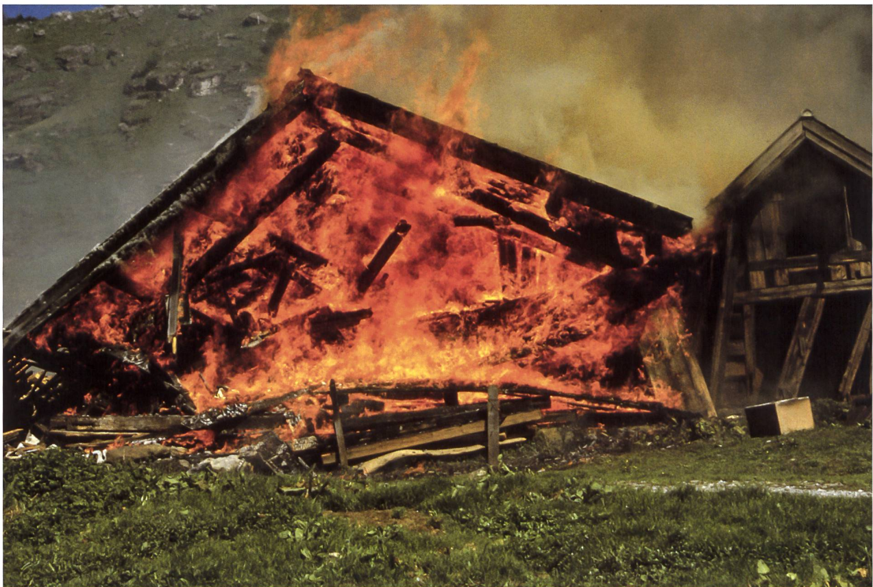
Das zerstörte Alt-Hütte-Zimmer wird aufgegeben, verfeuert und der Standort aufgeräumt. 1999.

Die Gesamtfläche der heutigen Grabser Ortsgemeindealpen beträgt rund 1500 Hektaren. Es sind dies folgende fünf Einheiten: Ivelspus, Voralp, Ischlawitz, Gamperfin und Naus. Verteilt auf diese Alpen existieren rund 50 Alpzimmer mit insgesamt 143 Einzelgebäuden.