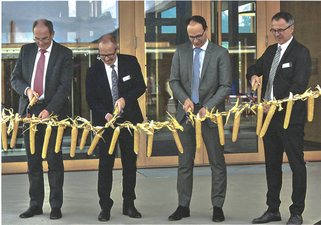
17.5.2019: Der Erneuerungsbau des Landwirtschaftlichen Zentrums LZSG Rheinhof, Salez, wurde – zweieinhalb Jahre nach der Grundsteinlegung – offiziell eingeweiht.

und Erweiterung Altersheim Möösli» mit Kosten von 2.54 Millionen Franken grünes Licht. Die Stimmbeteiligung betrug 46.2 Prozent. 20.5.2019