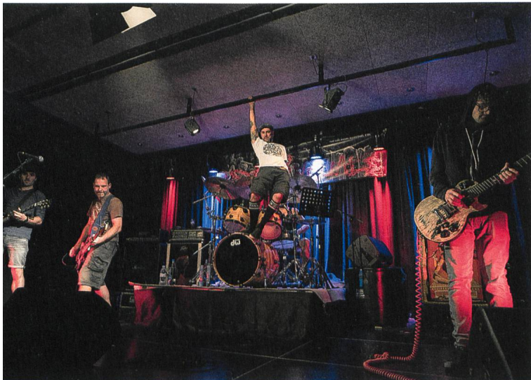
29. September 2017: Die Buchser Band The Sublinguals präsentiert ihr neuestes Album Anger im fabriggli.