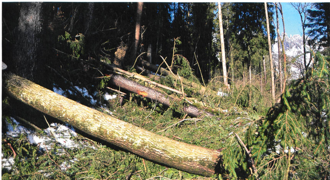
1. Februar 2018: Holz im Gamser Waldgebiet, das dem Sturm Burglind zum Opfer gefallen ist.

Nachwuchssportler Auszeichnung Der erfolgreiche Gamser Sportschütze Christoph Dürr wird anlässlich der Sport-Gala der IG St. Galler Sportverbände zum Nachwuchssportler des Jahres 2016 gekürt. 21.4.2017