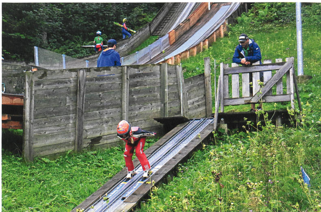
7.–11. August 2017: Über 1500 Kinder der Region nehmen an der Sportwoche teil. Hier zu sehen ist die Skisprungsschanze Chollersweid in Wildhaus.

12727 Flur-, Gelände-, Gewässer-, Berg-, Haus-, Weiler-, Strassen, Weg- und Dorfnamen aus allen Werdenberger Gemeinden aufgeführt, lokalisiert und sprachlich gedeutet. Das Werk umfasst neun Bände. 23.6.2017