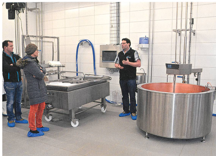
20. März 2018: Eröffnung der neuen Schulkäserei an der Landwirtschaftlichen Schule in Salez.