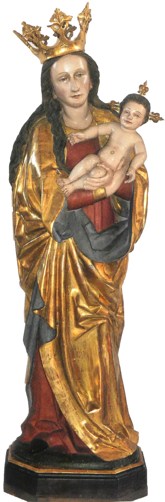
Muttergottesstatue, um 1490, aus der Kapelle Gasenzen; Fassung Anfang 20. Jahrhundert.

Beim Gamser Altar- und Vortragekreuz hervorzuheben ist, dass die ganze Garnitur, also Kreuz und Kreuzfuss, auf uns gekommen sind. Das ist sehr selten, obwohl ursprünglich zu den meisten alten Vortragekreuzen solche Kreuzfüsse geschaffen worden sind. 5 Deshalb ist es angezeigt, diese Garnitur kurz zu beschreiben. Die Zarge des Vierpassfusses mit den Zwickeln sowie die untere Zwinge sind mit den zeittypischen, zarten, spiralig angeordneten Blättchenrankten verziert – genauso wie die rückseitigen Balkenbleche des Kreuzes. 6 Die Balkenbleche der Vorderseite sind wohl späterer Ersatz. Original sind noch der qualitätsvolle, in Bronze gegossene und vergoldete Dreinagelkuzifixus sowie die zoomorphen Evangelistenscheiben auf den dreipassigen Balkenenden. Der Hintergrund der einzelnen Scheiben war ursprünglich ziemlich sicher einfarbig emailliert. In der Vierung, über dem Haupt des Gekreuzigten, ist eine verglaste Kapsel montiert, die einen Kreuzpartikel birgt. Diese Reliquienkapsel wurde, wie die vier Kapseln der Rückseite, im 19. Jahrhundert angebracht.