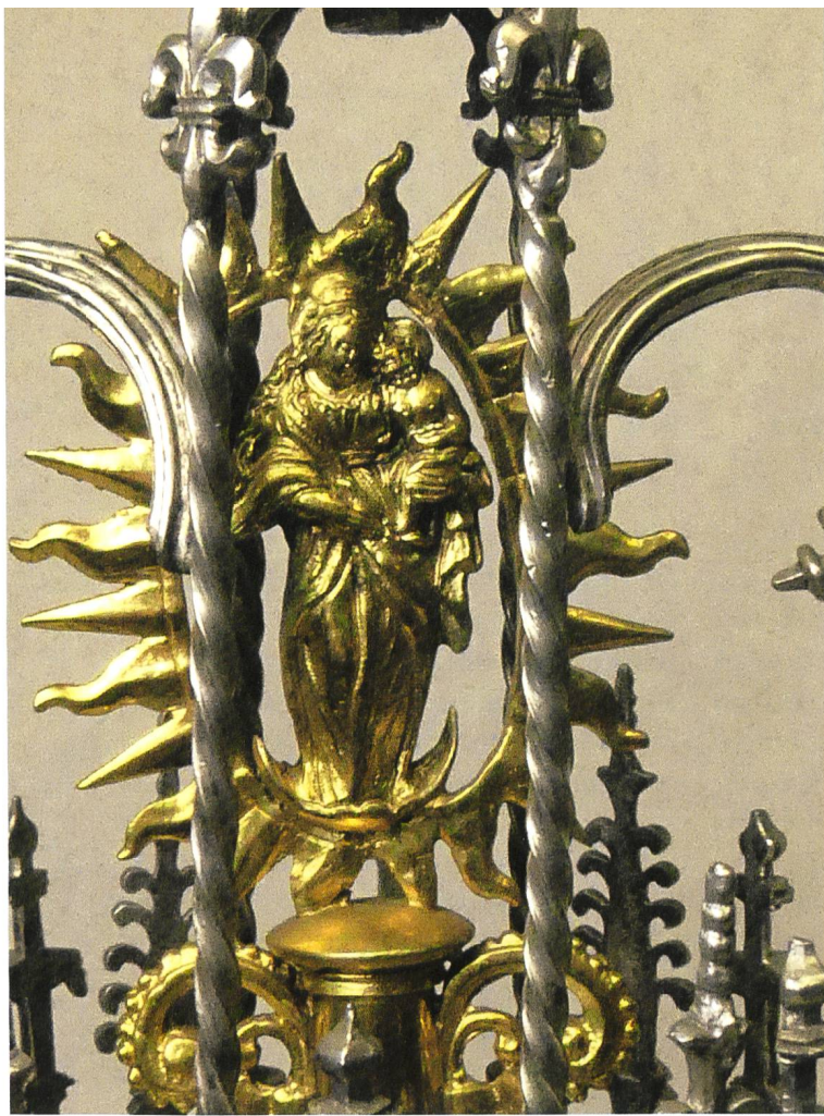
Muttergottesfigürchen an der Monstranz von 1628.