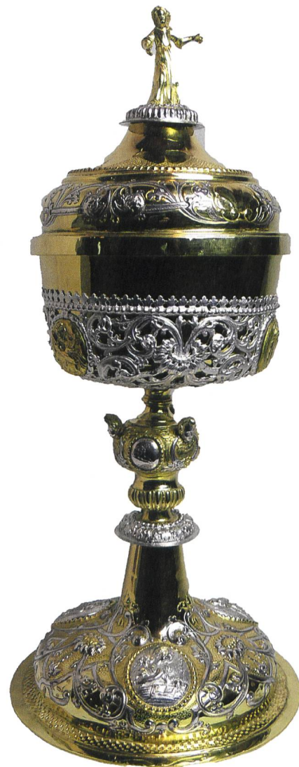
Ziborium von 1715.