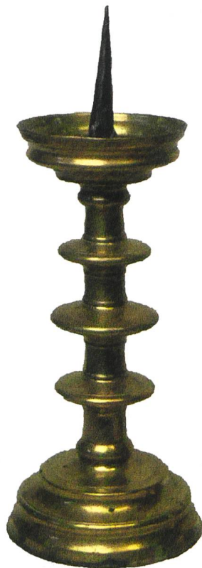
Mittelalterlicher Altarleuchter aus dem Gamser Kirchenschatz.

Aus der Zeit um 1500 sind auch zwei bronzene Altarleuchter auf uns gekommen. Wegen ihrer Form werden derartige Leuchter Scheibenleuchter genannt. Solche Leuchter wurden von Stuck- und Glockengiessern geschaffen. Die beiden Leuchter könnten durchaus in Feldkirch gegossen worden sein, jedenfalls sind um 1490 bis 1520 in Feldkirch zwei Stuck- und Glockengiesser nachweisbar. 11 Wenzel Löffler, der bis 1521 in Feldkirch einer Giesserei vorstand, war der Sohn des berühmten Stuck- und Glockengiessers Peter Löffler, der, von Feldkirch kommend, bei Innsbruck eine Giesserei betrieb und vor allem als Giesser von Kanonen vom europäischen Hochadel geschätzt wurde.