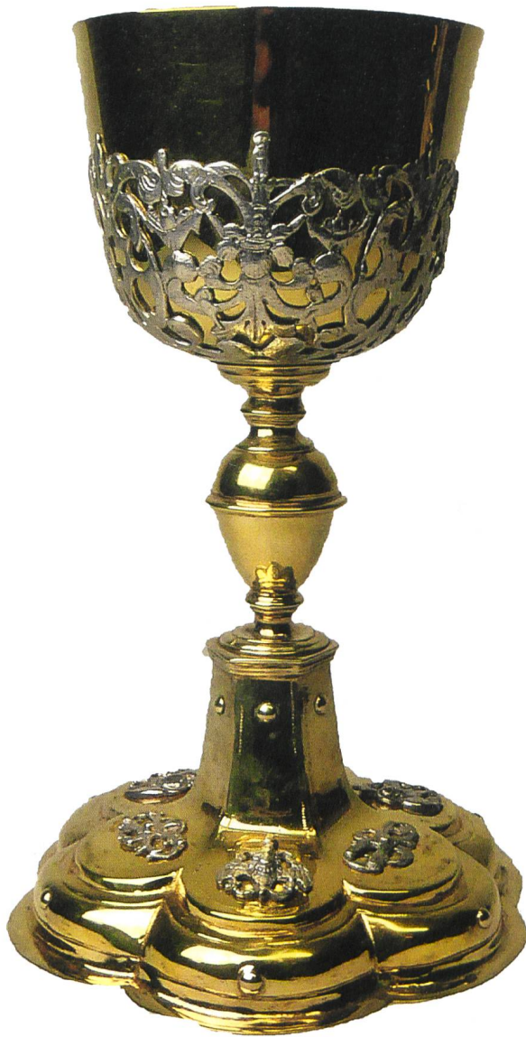
Frühbarocker Messkelch von Franz Clessin, um 1630/40.