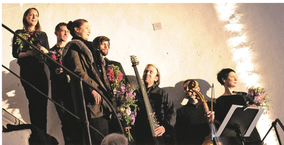
22. Mai: Die Musiker und Sänger des Early Bird Ensembles machten den Auftakt zur zehntägigen Schlossmediale auf Schloss Werdenberg.

28.-31. Am Turnier des Reitvereins Werdenberg wird toller Springsport gezeigt. Mit Adrian Oehrli und Marina Gunthli stehen auch Werdenberger zuoberst auf dem Podest.