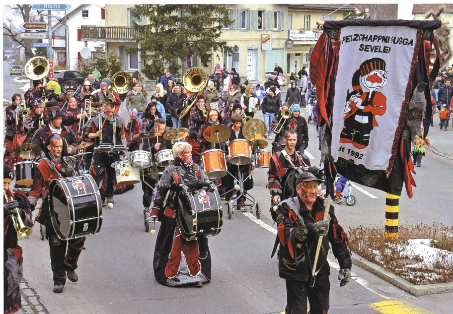
7. Februar: In Sevelen sind die Narren los. Hier führt die Pelzchappni Gugga den Kinderumzug durchs Dorf an.