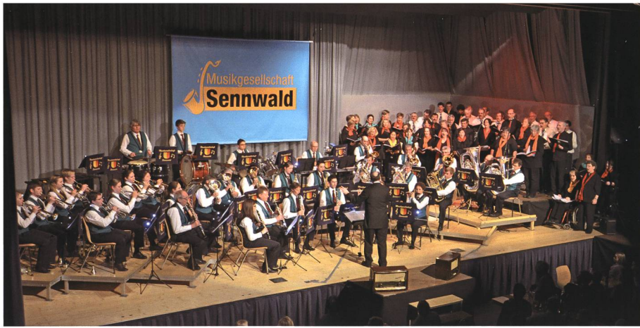
27. März: Die Musikgesellschaft Sennwald feiert mit einem grossen Unterhaltungsabend ihr 125-Jahr-Jubiläum.