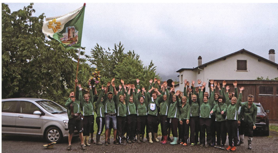
21. Juni: Die Turnerinnen und Turner aus Weite können sich über Erfolge am St. Galler Kantonalturfest freuen.

20. Der Lions Club Werdenberg veranstaltet einen grossen Kinderkrebs-Benefizanlass . In dessen Mittelpunkt steht der HC Davos , der zum Fussballspiel gegen den SC Rheintal aufläuft. Der Benefizerlös beträgt 62 000 Franken .