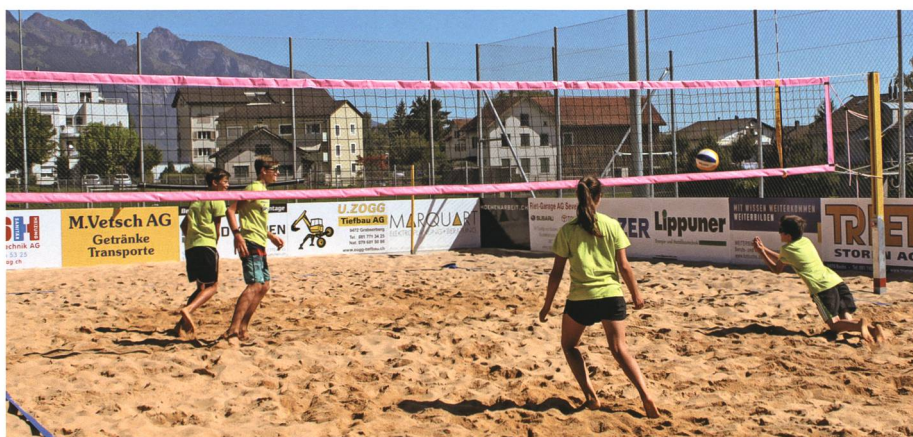
3.–7. August: Die Sportwoche bietet Hunderten von Kindern in der Region Betätigung in verschiedensten Sportarten.

22. Die Ursache für den Brand im Clubhaus der Hells Angels am Werdenberger See in Buchs vom Mai ist geklärt: Die