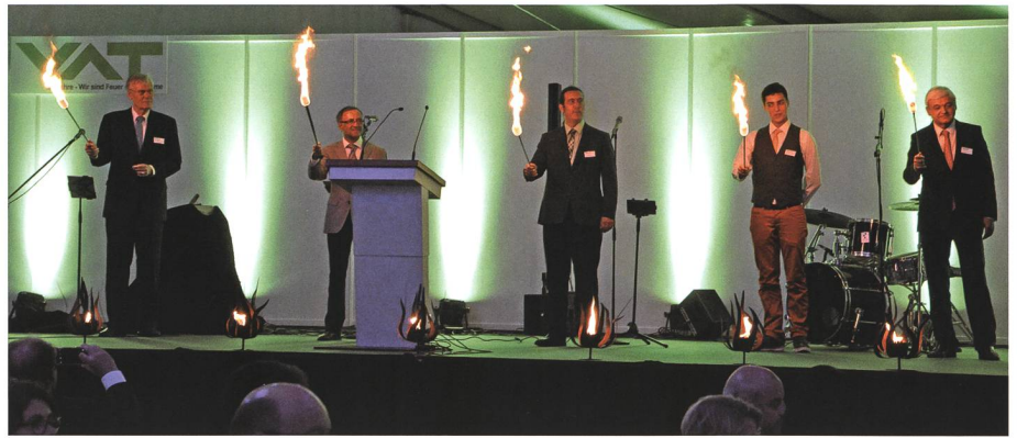
12. Juni: An der Feier zum 50-jährigen Bestehen der VAT AG in Haag zeigen sich drei VAT-Generationen ganz «Feuer und Flamme».

3. Am Ende der Junisession tritt der Buchser SVP-Politiker August Wehrli aus