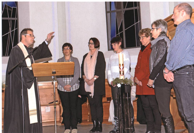
1. Januar: In Gretschins und Azmoos wird die «Geburt» der neuen Evangelisch-reformierten Kirchgemeinde Wartau gefeiert.