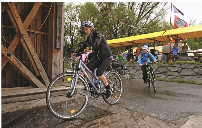
3. Mai: Trotz wenig einladendem Wetter wird der 10. slowUp Werdenberg-Liechtenstein zum Volksfest mit rund 13 000 aktiv Teilnehmenden.