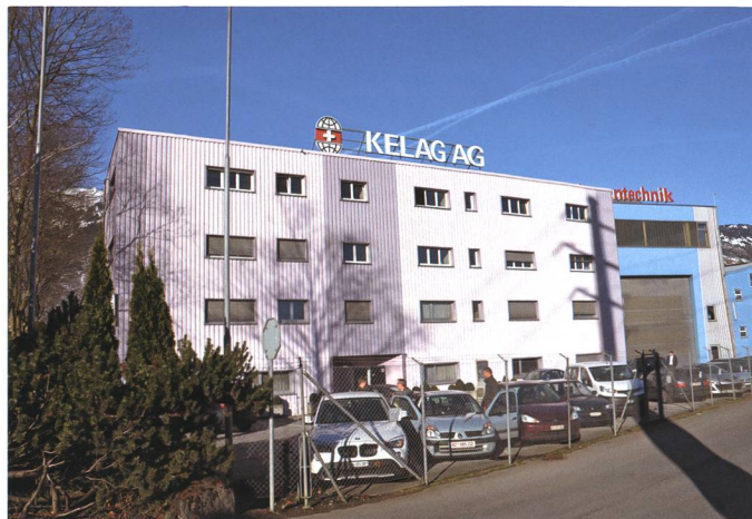
6. Januar: Schweizer Privatinvestoren übernehmen Teile der Kelag-Gruppe in Sennwald. Es gibt 44 Kündigungen.

Millionen Franken. Der Gemeinderat hat darauf einen « Marschhalt » beschlossen. Die Situation werde mit den Planern genau analysiert, heisst es von seiten des Gemeinderates.