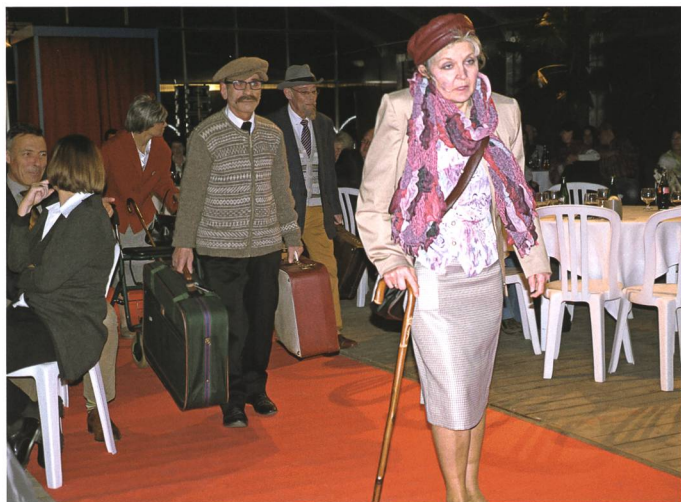
14. November: Insassen der Strafanstalt Saxerriet und Sennwalder Lehrkräfte bringen einen Theater-Krimi auf die Bühne.