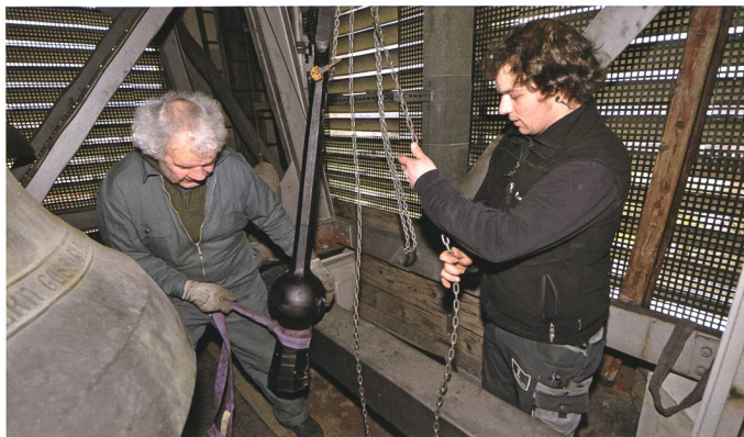
24. Februar: Die grosse Kirchenglocke von Grabs kann wieder läuten – der vor Weihnachten gebrochene Klöppel wird ersetzt.