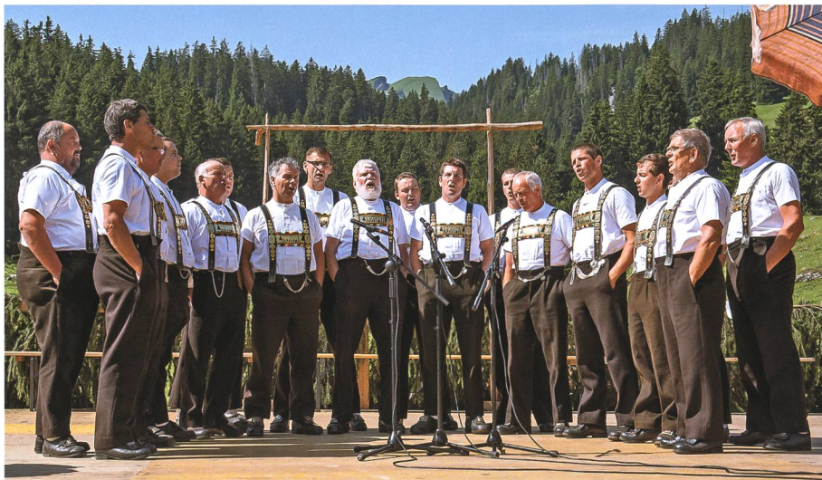
5. Juli: Der Jodlerklub Bergfinkli Grabs bietet an der Älplerchilbi auf Gamperfin einmal mehr ein abwechslungsreiches Programm.

4. Der rutschige Belag des Kreisels Dornau in Trübbach hat immer wieder für