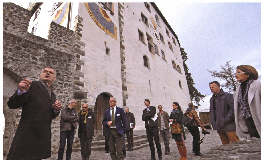
27. März: Nach Einsatz von 4,7 Millionen Franken wird das Schloss Werdenberg mit Bistro und neuem Museum eröffnet.

23. Die Kantonspolizei St.Gallen präsentiert die Kriminalstatistik 2014 . Auf die Polizeiregion Werdenberg-Sarganserland entfallen 3093 Straftaten (Vorjahr: 3317).