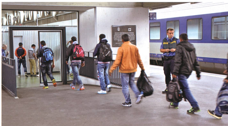
16. September: Im Bahnhof Buchs treffen in diesen Wochen täglich Flüchtlinge vor allem aus Syrien und Afghanistan ein.

18. Die Buchscher Schule feiert die Einweihung mehrerer Neu- und Erweiterungsbauten bei den Schulanlagen Hanfland und Grof . Die Bauten liegen im Budget von insgesamt 16,4 Millionen Franken. Tags darauf findet ein Tag der offenen Tür statt.