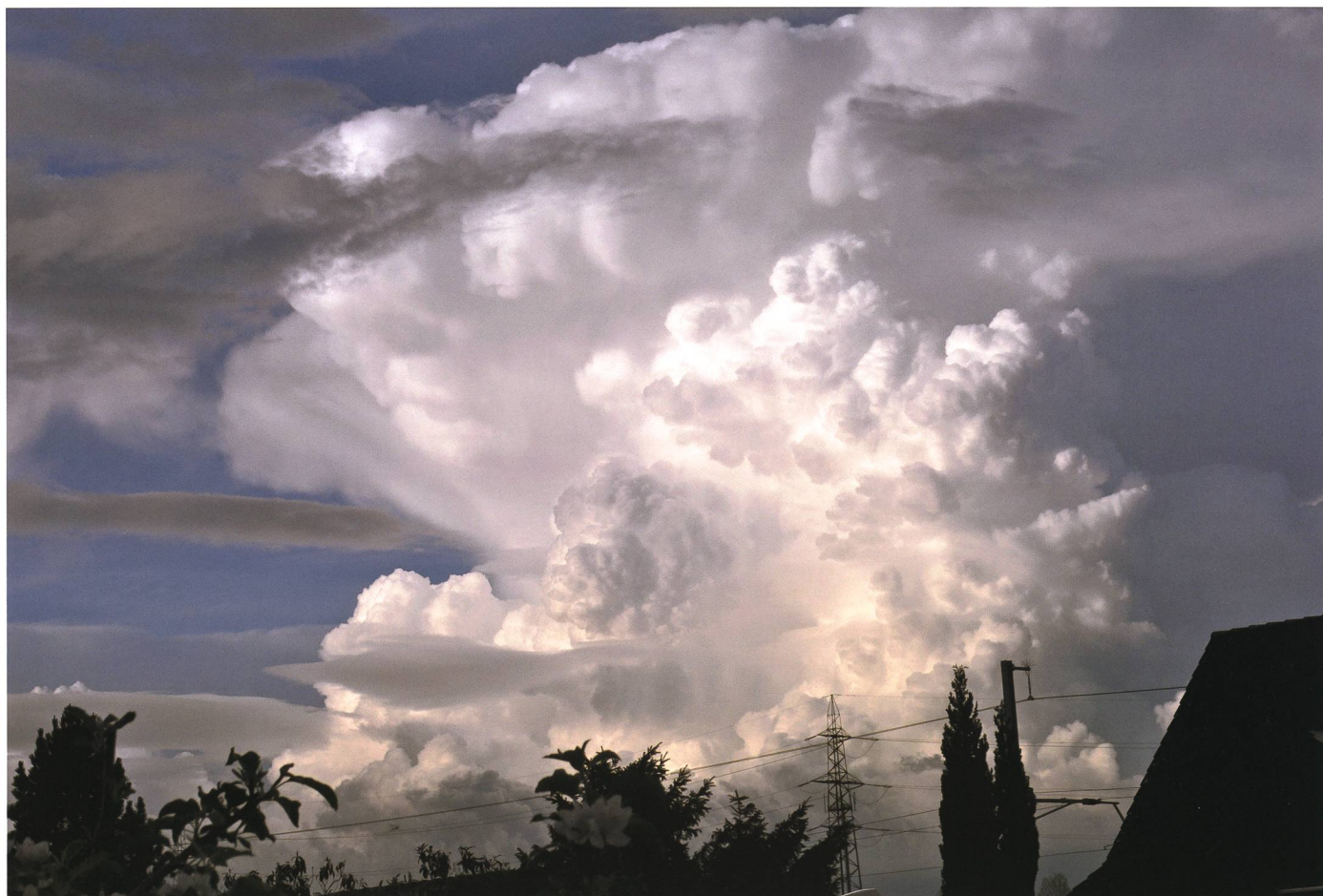
Aufbau einer Gewitterzelle über dem Liechtensteiner Unterland am 28. April 2015.