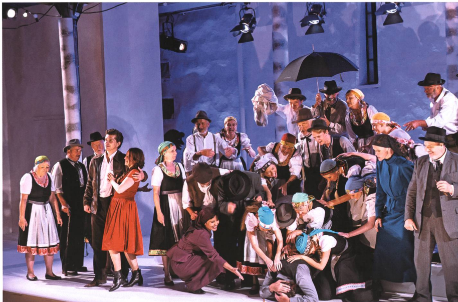
7. August: Mit Smetanas «Die verkaufte Braut» feiern die Werdenberger Schloss-Festspiele eine begeisternde Premiere.

Kantonspolizei geht von Brandstiftung aus. Die Täterschaft ist unbekannt.