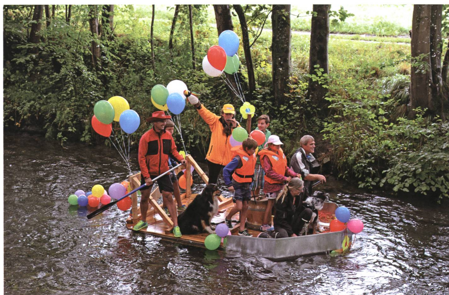
16. August: Die Chübelregatta der Buchser Pontoniere bringt kunterbuntes Leben auf den Binnenkanal.

11. Im Textil- und Heimatmuseum Sennwald wird eine Ausstellung mit historischen Ansichtskarten aus der Sammlung von Roger Urfer eröffnet.