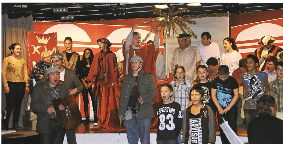
21. Dezember: Grabser Schüler und Bewohner und Mitarbeitende des Lukashauses bieten ein gemeinsames Weihnachtsspiel.

20. Es wird bekannt, was die Detailplanung für den Neubau des Werkhofs Sennwald in Salez ergeben hat: Die Baukosten laufen aus dem Ruder . Laut aktuellem Stand würde der neue Werkhof – inklusive Land – 6,6 Millionen Franken kosten. Der auf Basis des Vorprojekts mit Kostenberechnungen von den Stimmbürgern am 17. Juni 2012 genehmigte Kredit beträgt aber lediglich 4,6