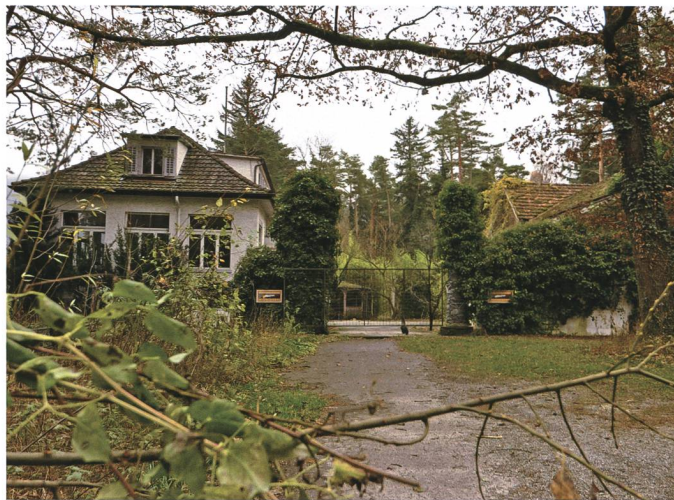
6. Dezember: Die Liegenschaft Heuwiese in Weite mit dem leerstehenden Restaurant kommt in öffentliche Hand.

zialetiketten, die Bedienung des Heimmarktes sowie Anwendungen für die Pharmaindustrie.