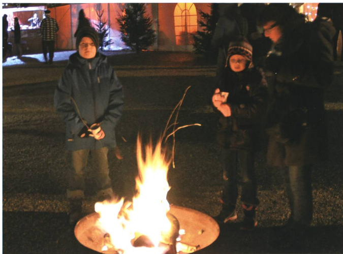
5.–7. Dezember: Am Chlausmarkt auf dem Buchser Marktplatz werden auch Feuerschalen zum Aufwärmen geschätzt.