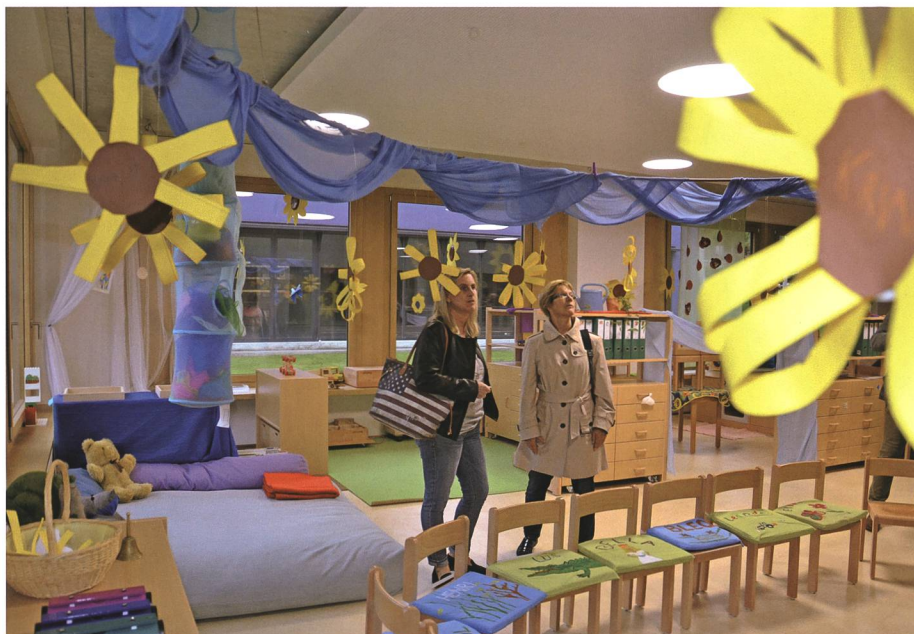
18. September: Mit einem «Tag der offenen Tür» zeigt die Buchser Schule mehrere Neu- und Erweiterungsbauten.