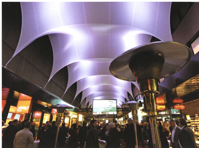
28. November: Die Metzgergasse in Buchs wird durch eine Membranüberdachung zur «Genuss- und Erlebnissgasse».