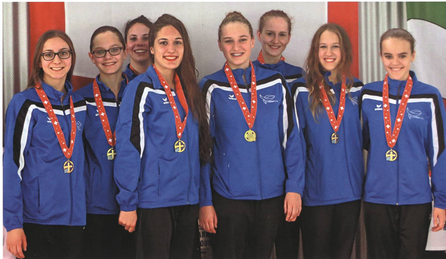
18./19. April: Vier Gold-, eine Silber- und eine Bronzemedaille ist die Ausbeute der Synchronschwimmerinnen des SC Flös an den Schweizer Meisterschaften.