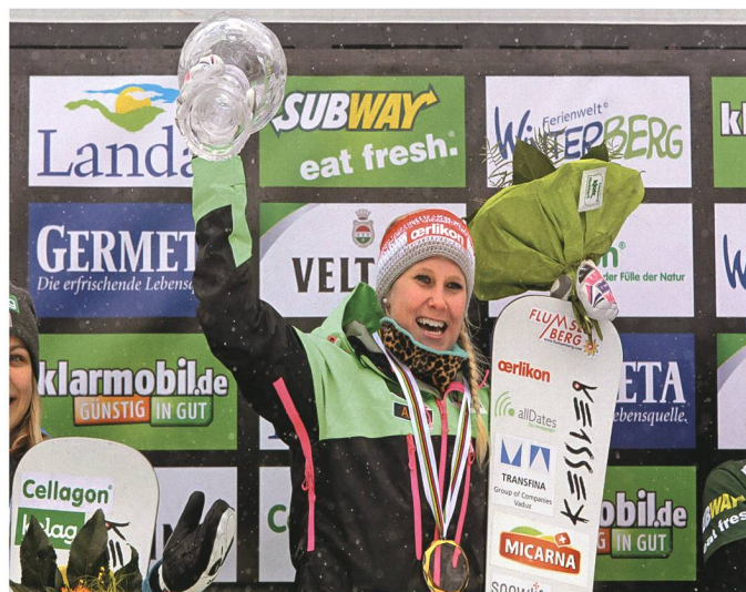
14. März: Die Wartauerin Julie Zogg gewinnt den Gesamtweltcup der Alpin-Snowboarderinnen.