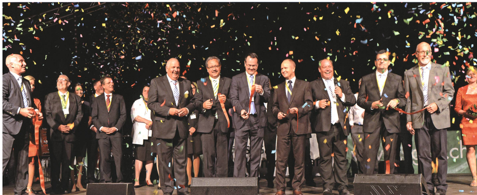
5. September: Unter dem Motto «Füür und Flamme» wird in Buchs im Beisein von viel Prominenz die Wiga 2015 eröffnet.

12. Die Feuerwehr Grabs weihet mit einem Tag der offenen Tür ihr neues Tanklöschfahrzeug ein.