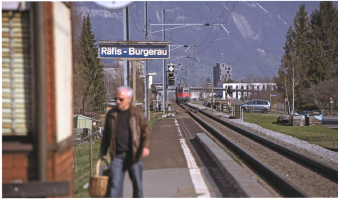
27. Oktober: Die Bahnstation Räfis-Burgerau bleibt aus «fahrplan-technischen Gründen» definitiv geschlossen.