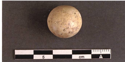
Abb. 25: Murren aus Ton.