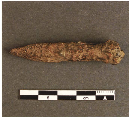
Abb. 12: Spätmittelalterliche Geschossspitze aus Eisen.