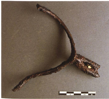
Abb. 11: Spätmittelalterlicher Eisensporn.