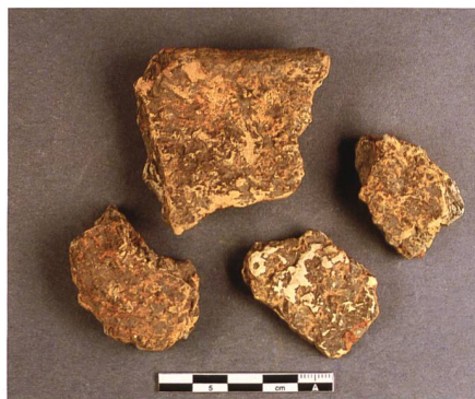
Abb. 10: Prähistorische Keramik.

ratsgefässe verwendet wurden. Aufgrund ihrer stratigrafischen Lage und der Verteilung innerhalb der Grabungsfläche können die Keramikreste dem möglichen Hausbefund im Bereich des «Marktplatzes» zugeordnet werden. Leider fehlen typologisch aussagekräftige Rand- und Bodenscherben, die eine genauere zeitliche Einordnung des keramischen Materials erlaubten. Die wenigen Exemplare deuten aber darauf hin, dass die Keramik in der ersten Hälfte des 1. Jahrtausends v. Chr., das heisst in der Spätbronzezeit oder älteren Eisenzeit, in Gebrauch war. Für eine genauere zeitliche Einordnung von Befund und Fundmaterial müssen die Ergebnisse der naturwissenschaftlichen Untersuchungen abgewartet werden.