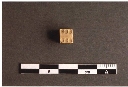
Abb. 23 und 24: Spielwürfel und Pochstein.

Münzähnliche Objekte mit religiösem Hintergrund wie beispielsweise Weihe- oder Gnadenpfennige, denen eine Schutzfunktion zukam, wurden bei den archäologischen Untersuchungen nicht geborgen.