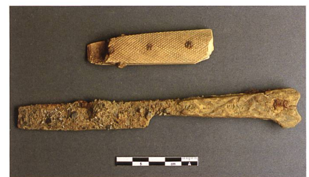
Abb. 16: Neuzeitliche Messerfunde.

Flaschen und Trinkgläser gehören wie die Geschirrk Keramik zu den alltäglichen Gebrauchsgegenständen. Hervorzuheben sind die Fragmente profilierter oder plastisch verzierter Trinkgläser (Abb. 15). Das Bodenfragment wie