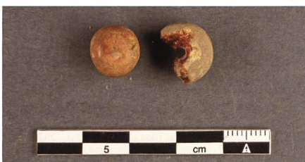
Abb. 21: Bernsteinfunde aus dem Städtli.

Eine andere Art von Kleiderverschluss dokumentieren Knöpfe (Abb. 19 und 20). Man stellte sie in einer grossen Formen- und Materialvielfalt her, wobei Knöpfe aus Bein (Knochen) oder Holz zu den eher schlichteren Varianten zählen.