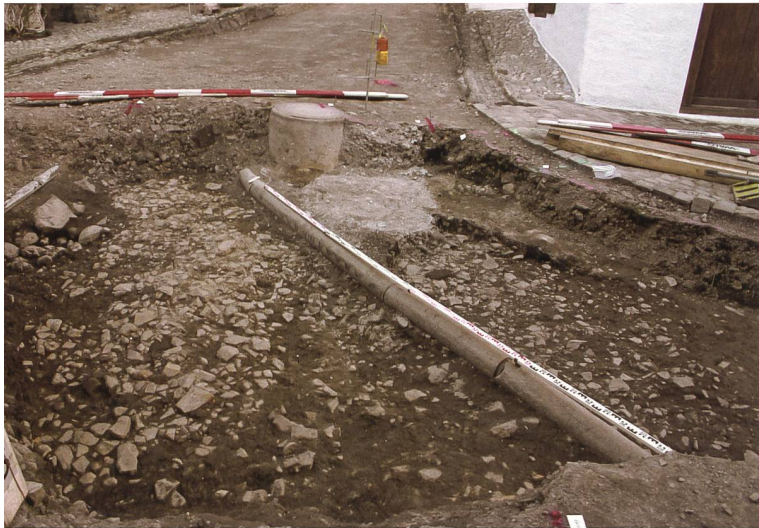
Abb. 7: «Marktplatz»: Planie und alte Störungen.