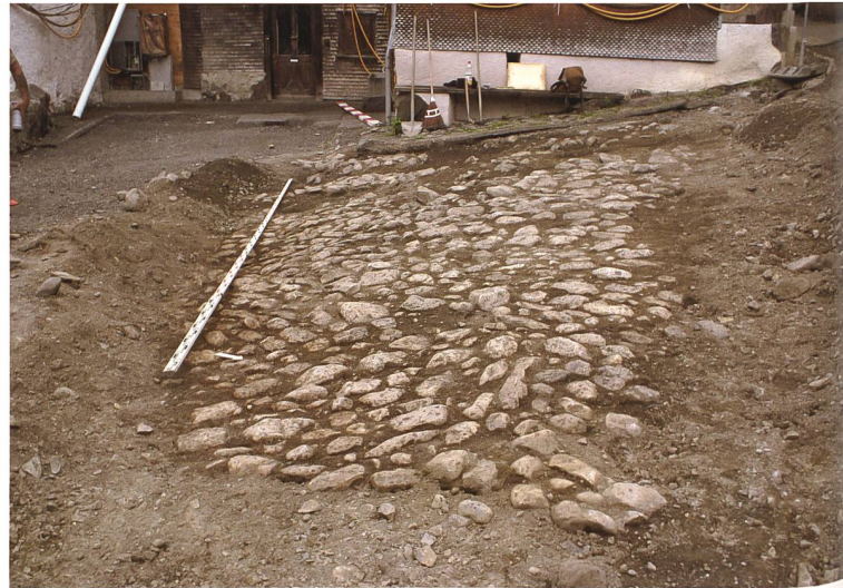
Abb. 8: Pflasterung im Bereich des Schlangenhauses.

material stammt zum allergrössten Teil aus der Region.