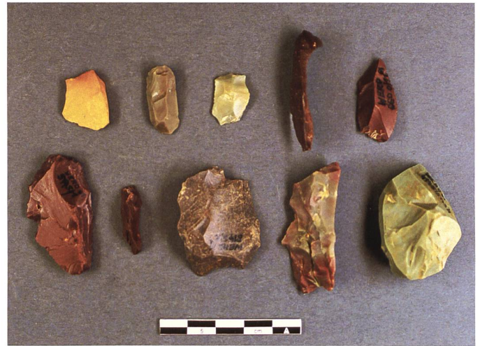
Abb. 3: Eine Auswahl der 1961 im Städtli geborgenen Silexartefakte.

die über Jahrtausende abgelagerten Schichten mit möglichen archäologischen Strukturen und Funden für immer zerstört. Ohne fachgerechte Dokumentation gehen so wichtige Informationen zur Geschichte für immer verloren. Aus diesem Grund war die Kantonsarchäologie von Beginn an in das Projekt eingebunden. Um einen reibungslosen Ablauf der Bauarbeiten ohne Bauverzögerung zu gewährleisten, wurde mit den technischen Betrieben der Gemeinde Grabs vereinbart, vor Baubeginn jene durch Bodeneingriffe betroffenen Bereiche, die das grösste archäologische Potenzial aufweisen, archäologisch genauer zu untersuchen. Vorgängige Sondagen beziehungsweise Baggerschlitzte an drei ausgewählten Stellen lieferten wichtige Informationen zu Bodenaufbau und Schichterhaltung. 2