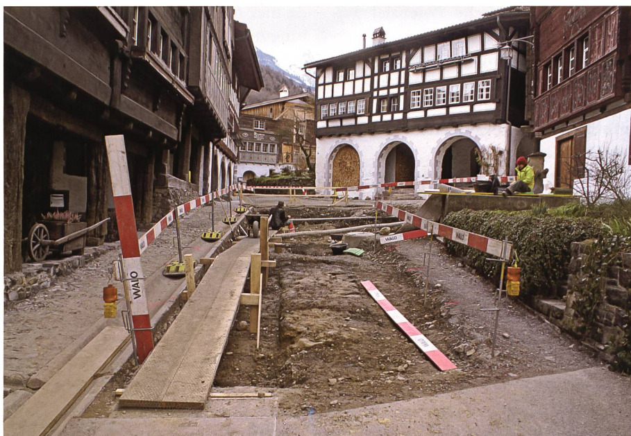
Abb. 5: Flächengrabung im Bereich «Marktplatz».

Unter einer mächtigen Auffüllschicht mit neuzeitlichen Funden konnte das Grabungsteam auf dem «Marktplatz» einen alten, unregelmässig gepflasterten Weg oder den Teil eines mit Steinen geplanten Platzes dokumentieren (Abb. 7). Die Struktur bestand aus mehrheitlich faustgrossen kantigen Steinen, die in lehmigem Sand eingebettet waren. Der Befund erwies sich auf der östlichen Seite des «Marktplatz-