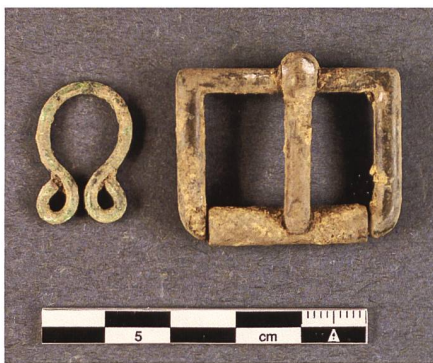
Abb. 18: Öse und Gürtelschnalle aus Buntmetall, Neuzeit.

Neben Textil- und Lederresten geben Gürtelschnallen sowie Kleiderhaken und -ösen aus Metall oder Knöpfe Auskunft über das modische Erscheinungsbild der Menschen (Abb. 18). So fanden sich diverse kleinteilige Gegenstände, die zur Kleidung gehören. Ösen oder Haken aus dünnem Bronze- oder Eisen- draht waren gewissermassen die Vorläufer des Reissverschlusses und dienten zum Schliessen von Mieder oder Wams.