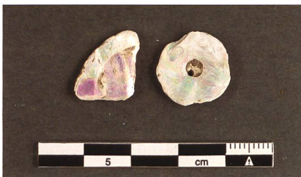
Abb. 19 und 20: Neuzeitliche Knöpfe aus Perlmutter (oben) und Knochen.