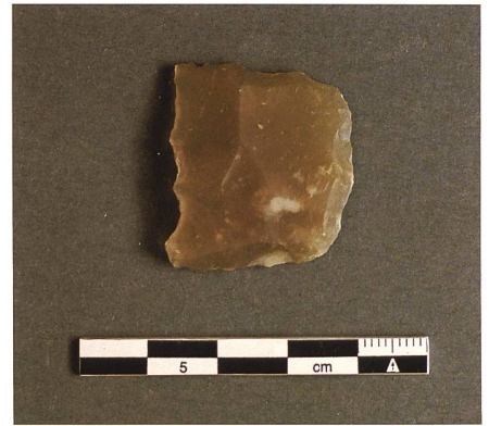
Abb. 13: Flintenstein, Neuzeit.