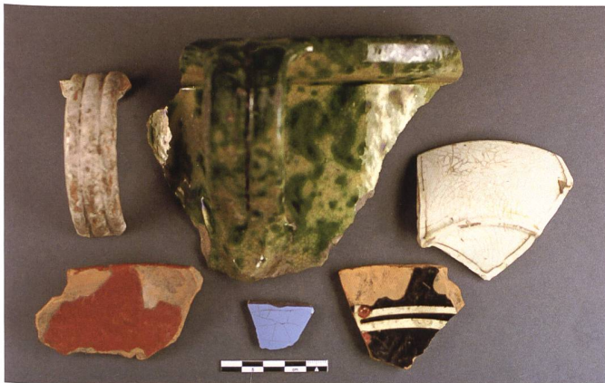
Abb. 14: Neuzeitliche Gefässkeramik aus Werdenberg.