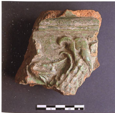
Abb. 22: Fragment einer aufwendig gestalteten und reliefierten Blattkachel.

(Abb. 23 und 24). Dieses Objekt aus (Elfen-?)Bein ähnelt stark den Steinen des Flohspiels und belegt vermutlich ein deutsches Kartenspiel, das im 16. Jahrhundert aufkam, heute aber kaum mehr bekannt ist: Poch 12 . Es wird zu viert mit 32 Karten gespielt, wobei die Spieler im Verlauf des Spiels Chips in die Vertiefungen eines mit acht oder neun Mulden versehenen Pochbrettes legen mussten. Bei der flachen Scheibe handelt es sich wohl um einen solchen Spielstein.