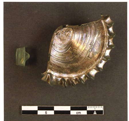
Abb. 15: Fragmente spätmittelalterlicher Trinkgläser.

Eisen, der zur Ausrüstung eines Reiters gehörte (Abb. 11).