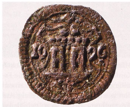
Abb. 26: Pfennig/Viertelkreuzer von 1696 mit einseitiger Prägung; Ravensburg, Stadt. Vergrössert, Durchmesser Original 13,8–12,7 mm.