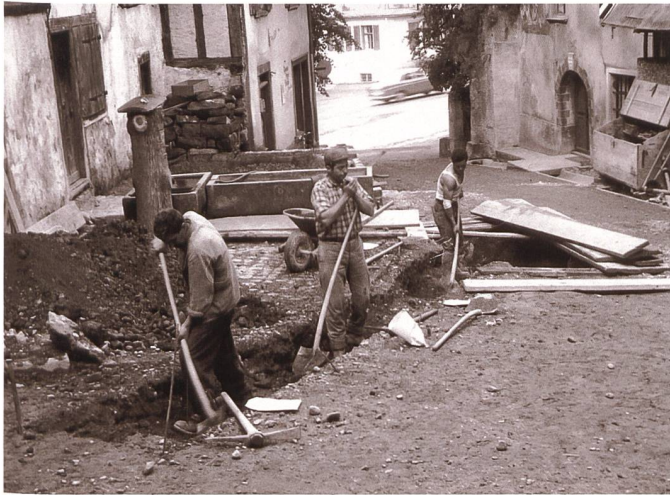
Abb. 2: Werkleitungssanierung im Städtli im Jahr 1961, in deren Rahmen archäologische Funde gemacht wurden.