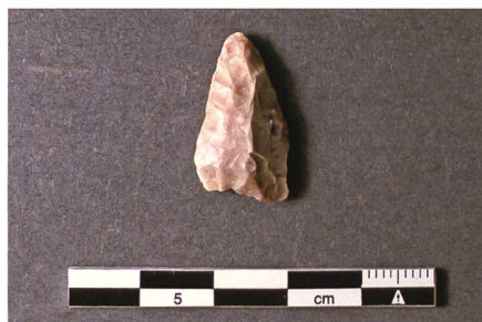
Abb. 9: Prähistorische Pfeilspitze aus Silex (Feuerstein).

Die geborgenen Gefässfragmente (Abb. 10), zur Hauptsache unverzierte Wandscherben, sind überwiegend grob gemagert und stammen vor allem von Töpfen, die zum Kochen oder als Vor-