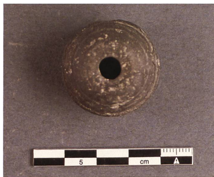
Abb. 17: Spätmittelalterlicher Spinnwirtel aus Ton.

bevorzugt gegessen worden sein, Ziege und Schaf sowie Wild haben bei der Ernährung wohl eher eine untergeordnete Rolle gespielt. 10 Fischwirbel und -schuppen belegen ausserdem den Verzehr von Fischen.