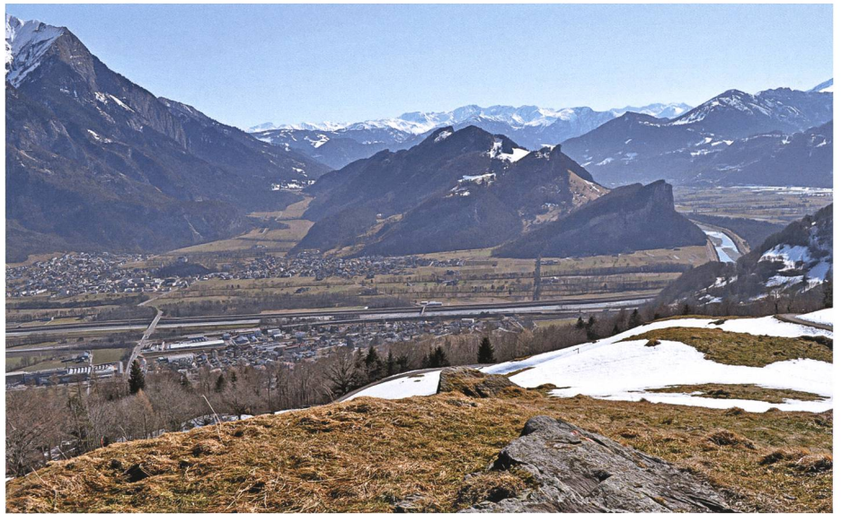
Die Luziensteig, das Tor zu Graubünden, war während des Zweiten Koalitionskrieges mehrfach Kampfhandlungen zwischen französischen und kaiserlichen Truppen ausgesetzt; rechts der Talkessel von Sargans.

Auch im Wartau ging 1798 alls z under obsig ; es herrschte grosses Durcheinander: Jetzt käme für alle Untertanen endlich jener Frühling, auf den schon die Alten vor hundert und mehr Jahren gewartet hätten, hiess es, die Riemen am Joch hätten schon wacker nachgelassen, und komme endlich der Franzose ins Land, bräuchte man keinen eidgenössischen Fuhrmann mehr. Die Ledigen in Azmoos fällten auf dem Mazifer eine grosse Lärche und schleppten sie mit sechs Pferden durch die Schollberggasse ins Dorf herunter. Bald stand sie aufrecht an der Sparren-gass mit einem mächtigen Kranz von Tannenreisig ringsum, und farbige Bänder flatterten daran. Das sei der Freiheitsbaum, hiess es landauf, land-ab. Die Leute schafften nicht mehr, alles feierte und festete. Gschallmeiat wört überall un tanzat, wia an ara Chilbi . In Kupfergelten wurde der Wein herbeigeschafft und mit da Gätzi , den grossen Schöpfkellen, verteilt. Jetz chönnan dia Herra Lampvöggt im Schloss Sarga's und Wärdabärg zsämmaphagga! Diese Vögel hätte man nun lange genug im Wingert gehabt, und der Trubajeeger aus Frankreich sei schon auf dem Weg,