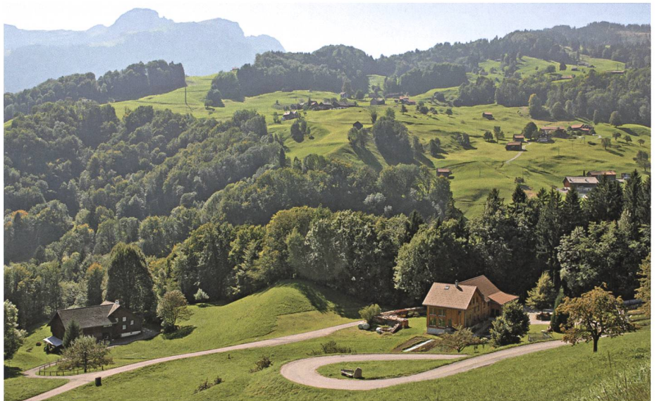
Das Gut Tobel unterhalb des Zollhauses gegen das Franzosenloch, wo die Gamser lautlos umgebrachte Besatzer verschwinden liessen.

Nachdem dann, wie die Geschichte lehrt, diese Angelegenheit nicht nach dem Plan der Gamser verlaufen war, machten sich die Franzosen zunächst in sieben Ställen längs der Simmi, dann aber auch im Dorf breit und führten ein schreckliches Regiment. Die gedemütigten Einwohner mussten nicht nur zusehen, wie alles ausgeplündert wurde und ihre schönsten Tiere aus den Ställen verschwanden, sondern sie wurden auch zu Schanz- und Fuhrarbeiten aufgeboten, während in Feld und Stall unterdessen alle Arbeit liegenblieb. Mit Pferde- und Ochsenge-spannen hatten die Bauern für die französischen Soldaten das Essen in Mels abzuholen, wo ein riesiger Verpflegungsplatz eingerichtet war. Beim Angriff auf Feldkirch mussten sie die Kriegsleute sogar über die unwegsame, versumpfte Rheinebene karren und durften das Schlachtfeld nicht verlassen, bis die Kämpfe vorbei waren. Als