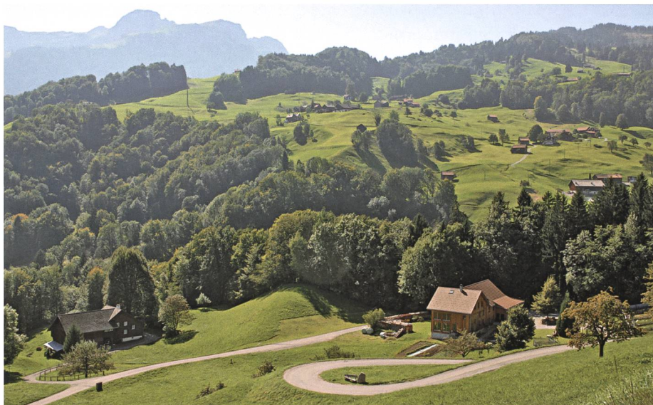
Das Gut Tobel unterhalb des Zollhauses gegen das Franzosenloch, wo die Gamser lautlos umgebrachte Besatzer verschwinden liessen.

Nachdem dann, wie die Geschichte lehrt, diese Angelegenheit nicht nach dem Plan der Gamser verlaufen war, machten sich die Franzosen zunächst in sieben Ställen längs der Simmi, dann aber auch im Dorf breit und führten ein schreckliches Regiment. Die gedemütigten Einwohner mussten nicht nur zusehen, wie alles ausgeplündert wurde und ihre schönsten Tiere aus den Ställen verschwanden, sondern sie wurden auch zu Schanz- und Fuhrarbeiten aufgeboten, während in Feld und Stall unterdessen alle Arbeit liegenblieb. Mit Pferde- und Ochsenge-spannen hatten die Bauern für die französischen Soldaten das Essen in Mels abzuholen, wo ein riesiger Verpflegungsplatz eingerichtet war. Beim Angriff auf Feldkirch mussten sie die Kriegsleute sogar über die unwegsame, versumpfte Rheinebene karren und durften das Schlachtfeld nicht verlassen, bis die Kämpfe vorbei waren. Als