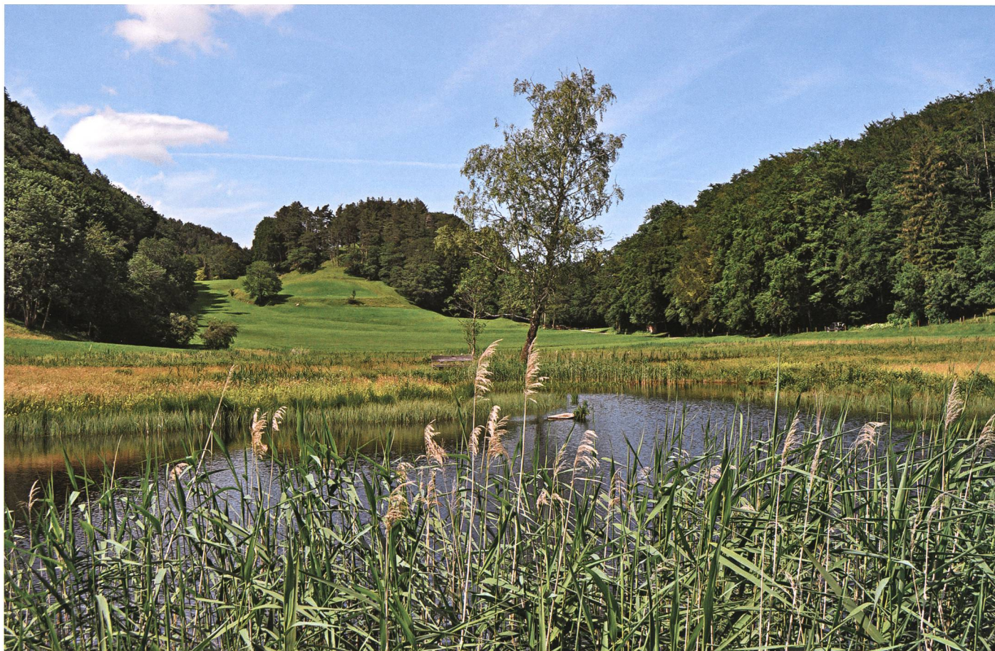
Schaner See gegen Mangis und Termbühel: Der Marchenbrenner im Plana hauchte hier sein Leben aus.

und ihn die Beine nicht mehr tragen wollen. Er wehrt und sperrt sich; aber alles nützt nichts, er torkelt in die Glut wie eine Mücke ins Licht. Er will sich wieder erheben, findet keinen Stand; er will sich überall halten an den brennenden Ästen und an den Wurzeln – sie aber lassen sich biegen und brechen. – « Fürio, Hülfio! »