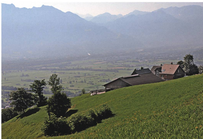
Eggli am Gamser Berg und helle Schläge vom Banzloch her: Hier teilt der nächtliche Stumper seine Hiebe aus.

Nach Henne 1874, S. 349; Kessler 1991, S. 68ff., Neufassung 2012, S. 23.