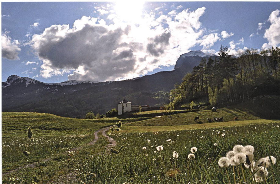
Gapluem gegen Chappili, Pfrundwingert und Pfarrersbüel: Fünf eingeebrannte Finger im Schaufelstiel erinnern an den Marchenrucker.

«Du, Jässi, steh auf, as pörrat ain an der Huistür ! – es poltert jemand an die Haustür!», ruft die Neasi auf Sabarra in Oberschan ihrem Mann zu un git am ai's mit am Ellaboga-n in d Ripp – und versetzt ihm einen Rippenstoss, «steh auf!» «Hou», bröolat der Jässi, «was