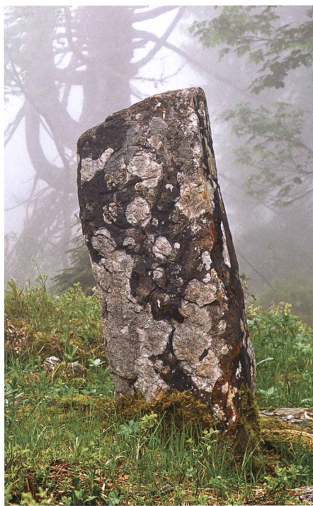
Grenzmarch aus dem Jahr 1569 in Hinderelabria: Jahreszahl auf der Vorderseite, Kreuzzeichen an den Schmalseiten sowie dem «Wartauer-Ringgen», dem Hoheitszeichen der Gemeinde, auf der Rückseite.

Maa n wandern, bis er erlöst wird. Oft ist das Erscheinen der Geister und Wiedergänger, die diese Freveltaten zu sühnen haben, mit Glut und Feuer verbunden; sie brennen teils lichterloh, so dass man durch die Rippen hindurchschauen kann – vielleicht als Symbol für die Hitze des Fegefeuers, worin die Täter bereits geschmort haben. Man hüte sich deshalb, deren Hände zu ergreifen, wenn sie zum Dank für die Erlösung gereicht werden; man halte ihnen statt dessen einen Holzstock, ein Scheit oder einen Werkzeugstiel hin. Als Teil des schon vom Fegefeuer Ergriffenen erscheint die Hand dann darin eingebrennt. Redet man sie an, so müssen sie Rede stehen, wer ihnen aber das erste Wort lässt, dem ergeht es übel. Im Allgemeinen können diese Sünder erlöst werden, da sie im Sinn der «armen Seelen» jene Gestalten sind, die sich zwar selbst nicht helfen können und Lebenshilfe zur Erlösung angehen