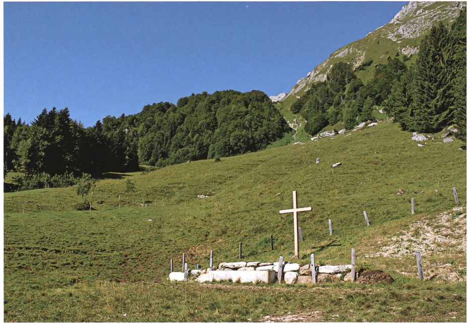
Im Igadeel. Nordseits des Igadeelbachs schreiten an späten Abenden dunkle Gestalten das Grenzmäuerchen ab.

Im Lungalid, gegen den Schleipfweg zu, hat sich ein ruheloser Marchenrücker viele Jahre lang bemerkbar gemacht. In zahllosen Nächten hieb er