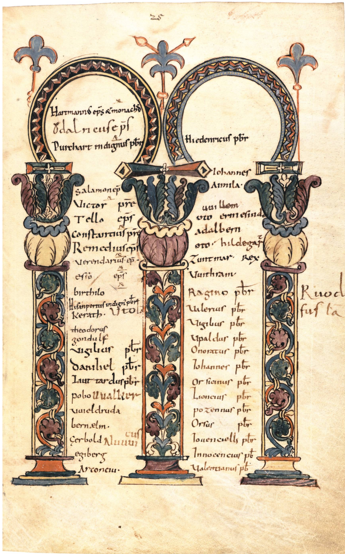
Doppelseite aus dem Liber viventium Fabariensis (Cod. Fab. 1, p. 24/25) mit Einträgen von fränkisch-alemannischen und rätischen Herrschern des 8./9. Jahrhunderts. Im Stiftsarchiv Pfäfers, St.Gallen