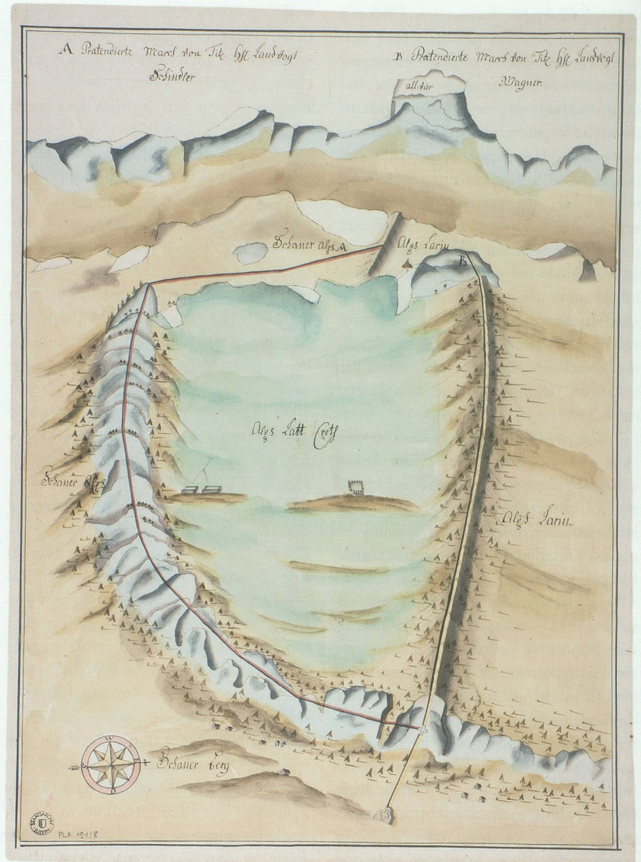
Situationsplan der Alp Plattegg von 1782 mit (in der Mitte links) den beiden Brunnen und (rechts) der schon damals verfallenen Hütte. Im Staatsarchiv Luzern