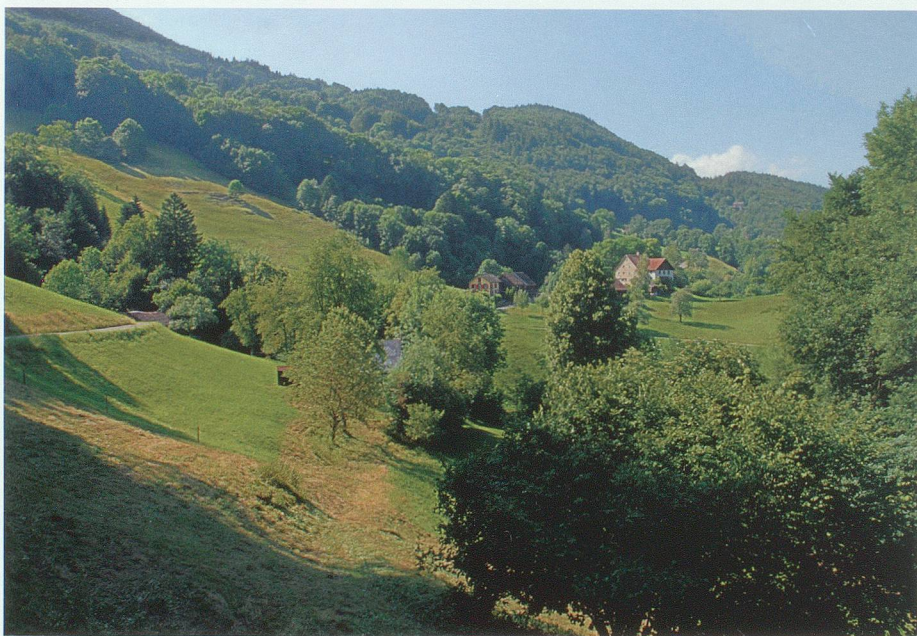
Das Gebiet Hof am Seveler Berg, vom Löchli her gesehen. Links die Strasse von Falschnära, die im Gehölzstreifen über den Stoggenbach führt.

1361 verkaufte Rudolf IV. von Sargans den Hof Blankenhusen und den Meierhof Blatten «gelegen oberhalb Sevelen nahe bei St. Ulrich» an das Kloster Pfäfers, das 1364 die Kapelle St. Maria Magdalena in Pfäfers mit beiden Höfen ausstatten liess. Sie lagen zwischen Stoggen- und Zweibach, zinsten zusammen 13 Scheffel Weizen und wurden 1451 6 als Ober- und Unterhof an den Blatten bezeichnet. Im Sarganser Urbar 1398 7 wird ein dritter, verpfändeter Hof namens Blatten mit einem Ertrag von 8 Scheffel Weizen genannt,