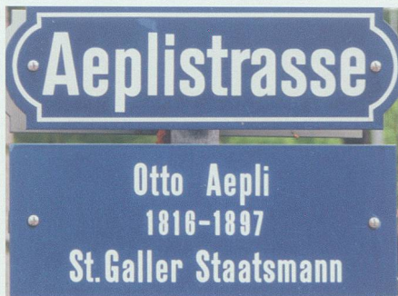
Die Aeplistrasse, eine parallel zur Langgasse verlaufende Quartierstrasse, erinnert in der Kantonshauptstadt an den «St.Galler Staatsmann» Otto Aepli.

Der Alpenrhein bereitete im ganzen 19. Jahrhundert schwerste Sorgen, wie man gerade auch im Werdenberg weiss. 1868 zum Beispiel bot sich im Rheintal der Anblick eines Sees mit der Fläche etwa des Thunersees! Ruhe kehrte erst im 20. Jahrhundert ein – trotz der vielen frühen Massnahmen und trotz des sukzessiven Einbezugs der zurückliegenden Gemeinden, des Kantons und des Bundes. Vor allem die St.Galler Regierungsräte Gallus Jakob Baumgartner, Matthias Hungerbühler und Otto Aepli haben sich auf Kantons- und Bundesebene laufend eingesetzt. Den östli-