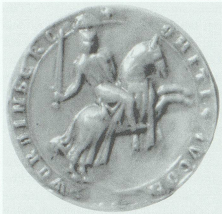
Reitersiegel Hugo I. von Werdenberg mit Schwert (1271–1286): + S.COMITIS. HVGONIS.DE.WERDINBERG.