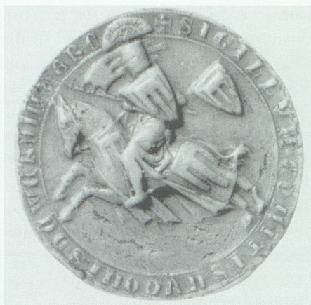
Reitersiegel Hugo I. von Werdenberg mit Lanze (1270–1284): + SIGILLVM. COMITIS. HVGONIS.DE.WERDINBERG.