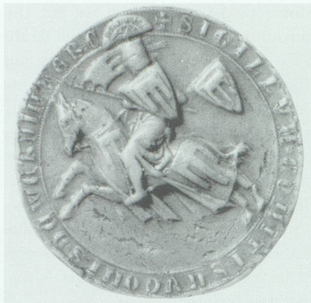
Reitersiegel Hugo I. von Werdenberg mit Lanze (1270–1284): + SIGILLVM. COMITIS. HVGONIS.DE.WERDINBERG.