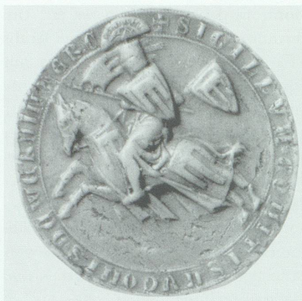
Reitersiegel Hugo I. von Werdenberg mit Lanze (1270–1284): + SIGILLVM. COMITIS. HVGONIS.DE.WERDINBERG.