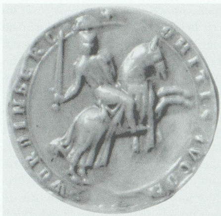
Reitersiegel Hugo I. von Werdenberg mit Schwert (1271–1286): + S.COMITIS. HVGONIS.DE.WERDINBERG.