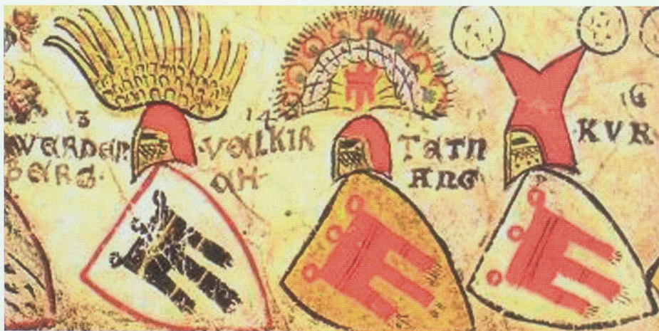
Die Wappen der Grafen von Werdenberg, Montfort-Feldkirch und Montfort-Tettnang (mit Beutelstand) in der Wappenrolle von Zürich, um 1340. Schweizerisches Landesmuseum, Zürich