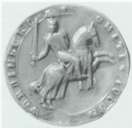
Reitersiegel Hugo I. von Werdenberg mit Schwert (1271–1286): + S.COMITIS. HVGONIS.DE.WERDINBERG.