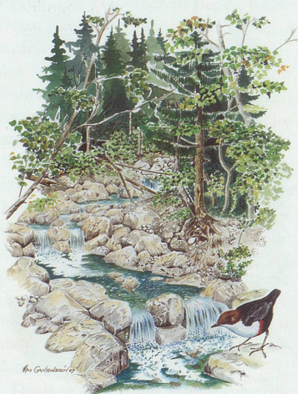
Das Kalenderblatt August.