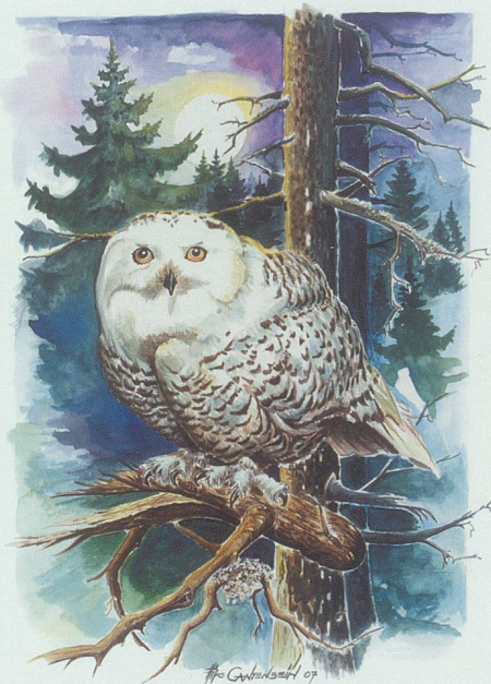
Das Kalenderblatt Dezember.