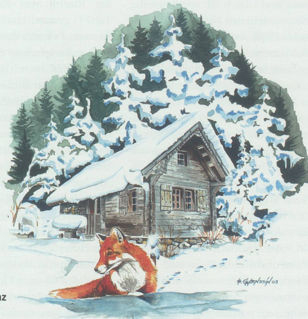
Der Fuchs beim Alpgebäude Schwanz in Ischlawiz.

Allen Unkenrufen zum Trotz ist er ein bodenständiger Künstler geblieben. «Meine Kunst lässt mir meine Freiheit», sagt er. Diese Freiheit nutzt er auch in seinen Bildern. «Meine Bilder sollen Freude machen, nicht nur weil ich viel Herzblut hineinstecke, auch weil viel (sportlicher) Ehrgeiz – es perfekt zu können – mit im Spiel ist. Das ist meine Motivation, nicht nur in der Kunst.»