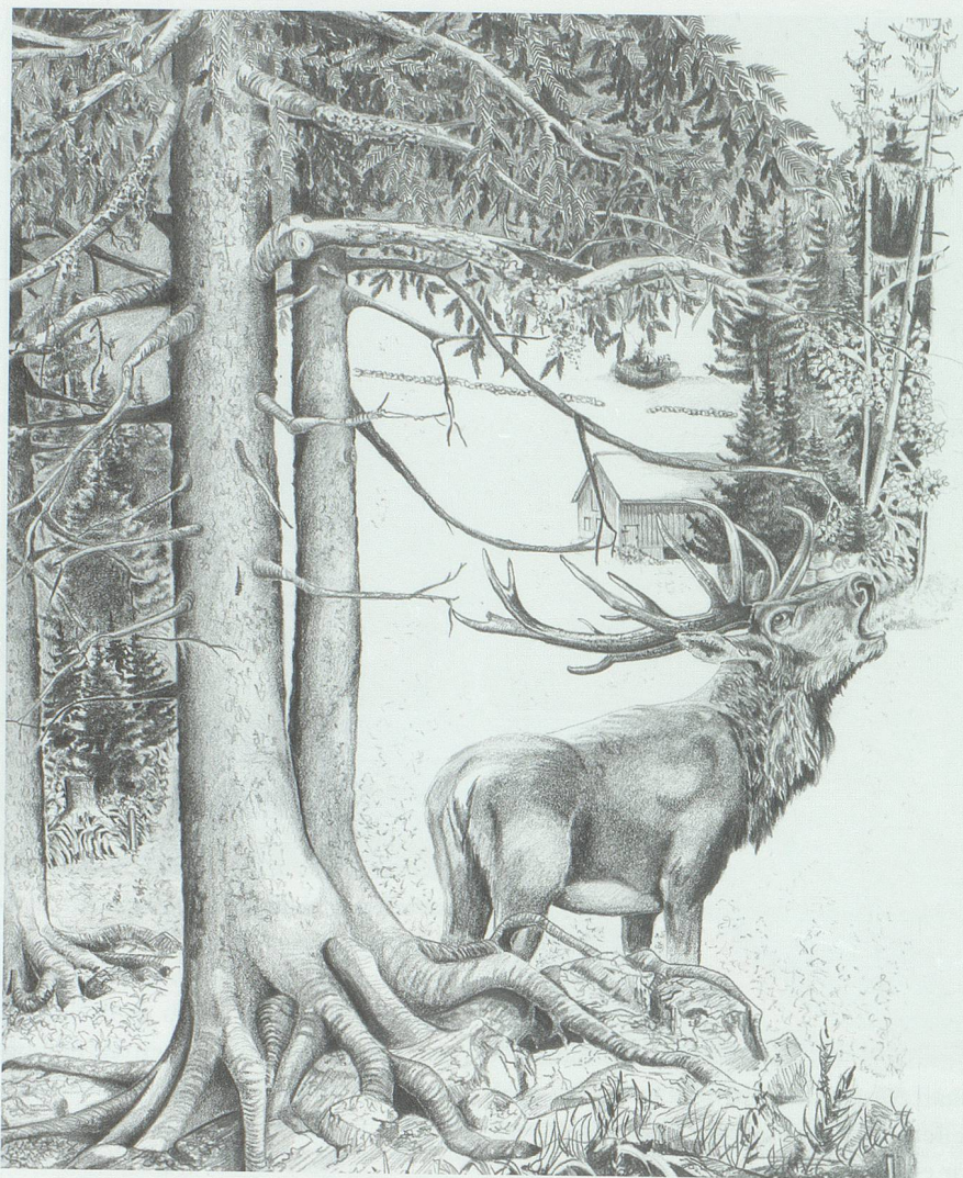
Hier schlägt das Herz eines Jägers schneller: ein röhrender Hirsch.