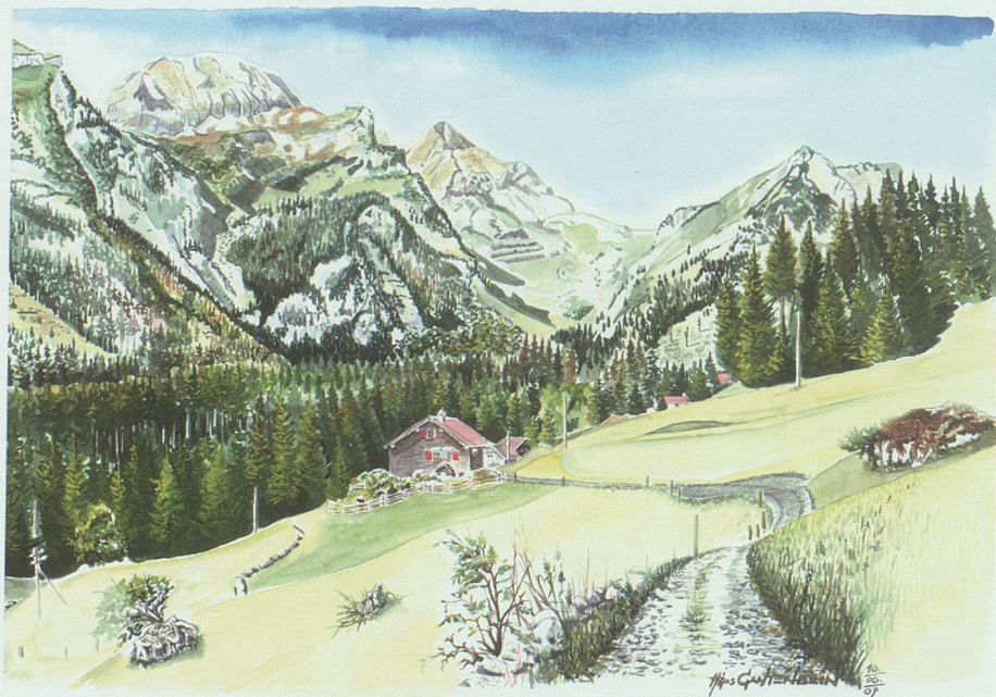
Leverschwendi mit Blick gegen Naus.