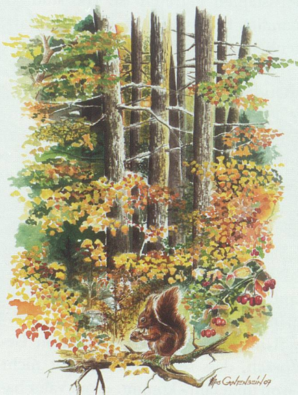
Das Kalenderblatt Oktober.

das Gen zum Freihandzeichnen vom Vater mit auf seinen Lebensweg bekommen hat.