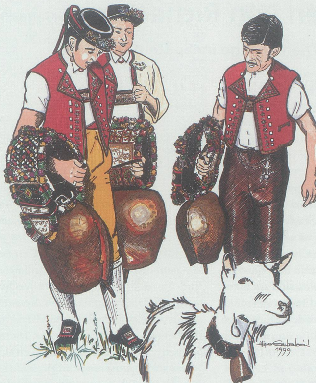
Äplerleben hautnah mit «Schellenschütte».