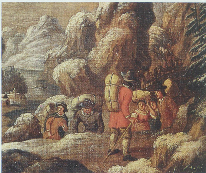
In Ermangelung von Saumpferden gelangte der «erkaufte Kernen» während der Hungersnot von 1770/71 durch Trägerkolonnen von Kleven (Chivanna) über den Splügenpass in die Ostschweiz.