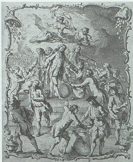
Kornverteilung während der Hungerkrise von 1771: «Denkmal ächter schweizerischer Frömmigkeit» – ein zeitgenössischer Kommentar, der der Wirklichkeit allerdings kaum entspricht.

Zu Recht aber gebührte dann dem Jahr 1811 das Prädikat eines Segensjahres, wodurch es sich unter der Bezeichnung «Eilferjahr» erhalten hat. «Zwar beunruhigte ein in der Nacht des 27. Februar erfolgter Erdstoss manches Gemüth, welches dagegen das frühzeitig eintretende Frühlingswetter mit allen Reizen des Lenzes erfreute. Die Getreidefelder und Obstbäume prangten im Sommer in herrlichster Fülle und reiften so frühe, dass Anfang Juli schon Brod aus diessjährigem Korn, neuer Most zu Ende Juli, und neuer Wein am 16. September genossen werden konnte. Die Qualität des Weins ge-