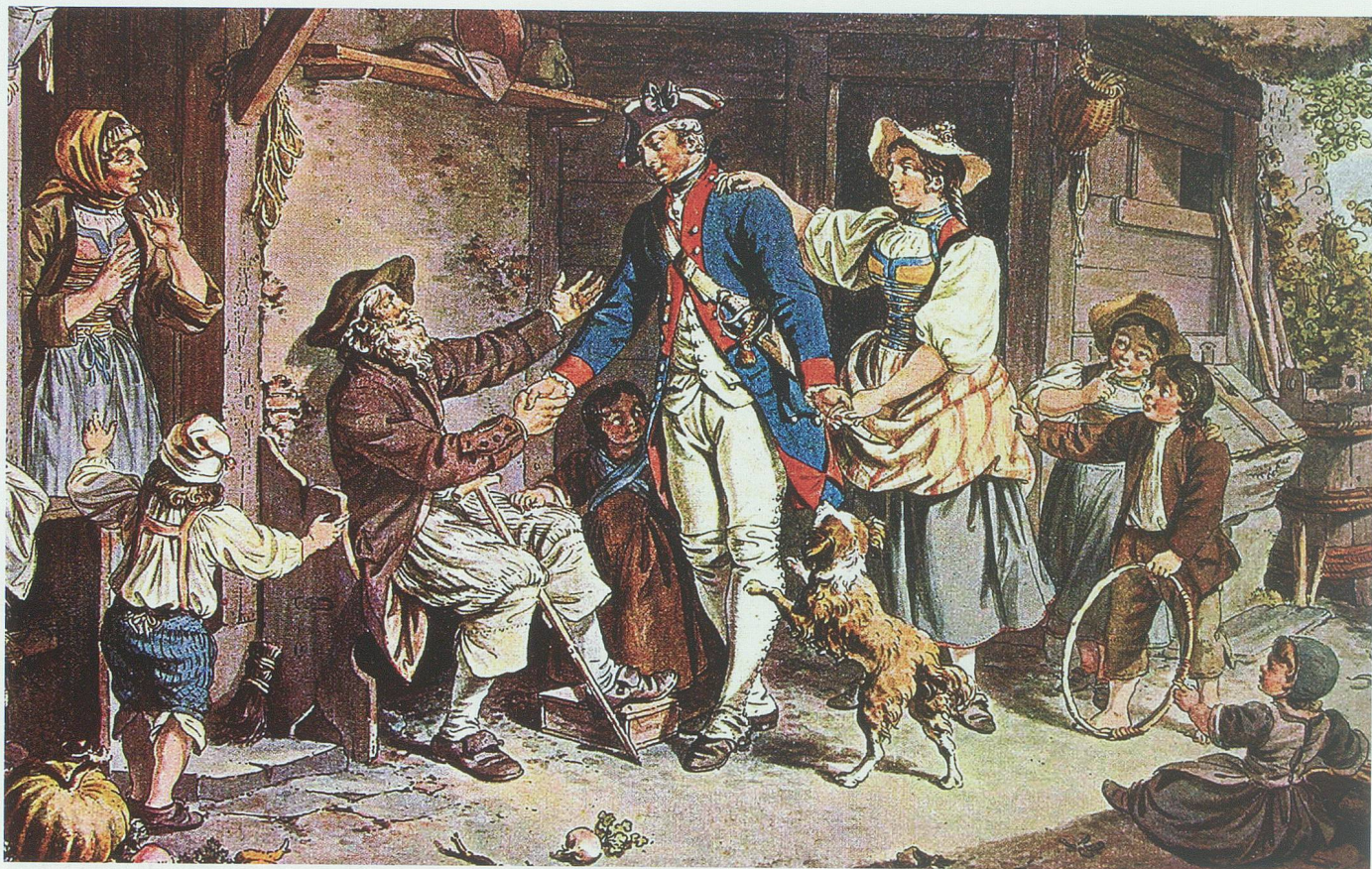
Ende des 17. Jahrhunderts betrachtete mancher Hungernde die Dienste um fremden Sold als Segen. Heimkehr eines Schweizer Gardisten aus französischen Diensten. Ausschnitt aus einem kolorierten Kupferstich von Siegmund Freudenberg (1745–1801). Kunstmuseum Basel