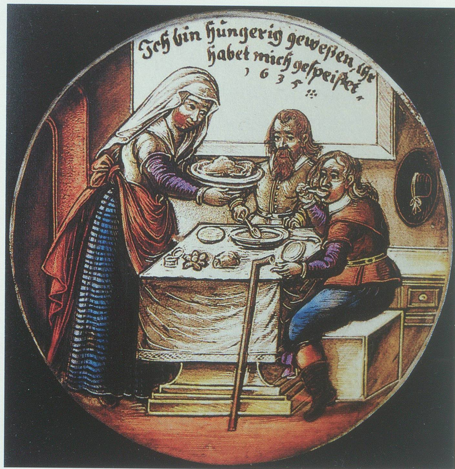
Barmherzigkeit und Nächstenliebe gegenüber Hungernden wurden durch die Abgabe von Suppe, Mus und Brot bis in die Neuzeit gepflegt. Glasmalerei aus dem 17. Jahrhundert. Bild aus Treichler 1991

Gänzliches Missraten der Ernte führte 1438 wiederum zu einer grossen Teuerung. 11 Aus dem Hitzesommer 1474 ist ein eher seltsames Phänomen überliefert, das wieder als «Theuerung» einer Mangelzeit vorangegangen war: Infolge der lang anhaltenden Dürre trockneten die Brunnen und Bäche aus, so dass «die Mühlen still standen, ob schon überaus viel und gutes Korn ge-