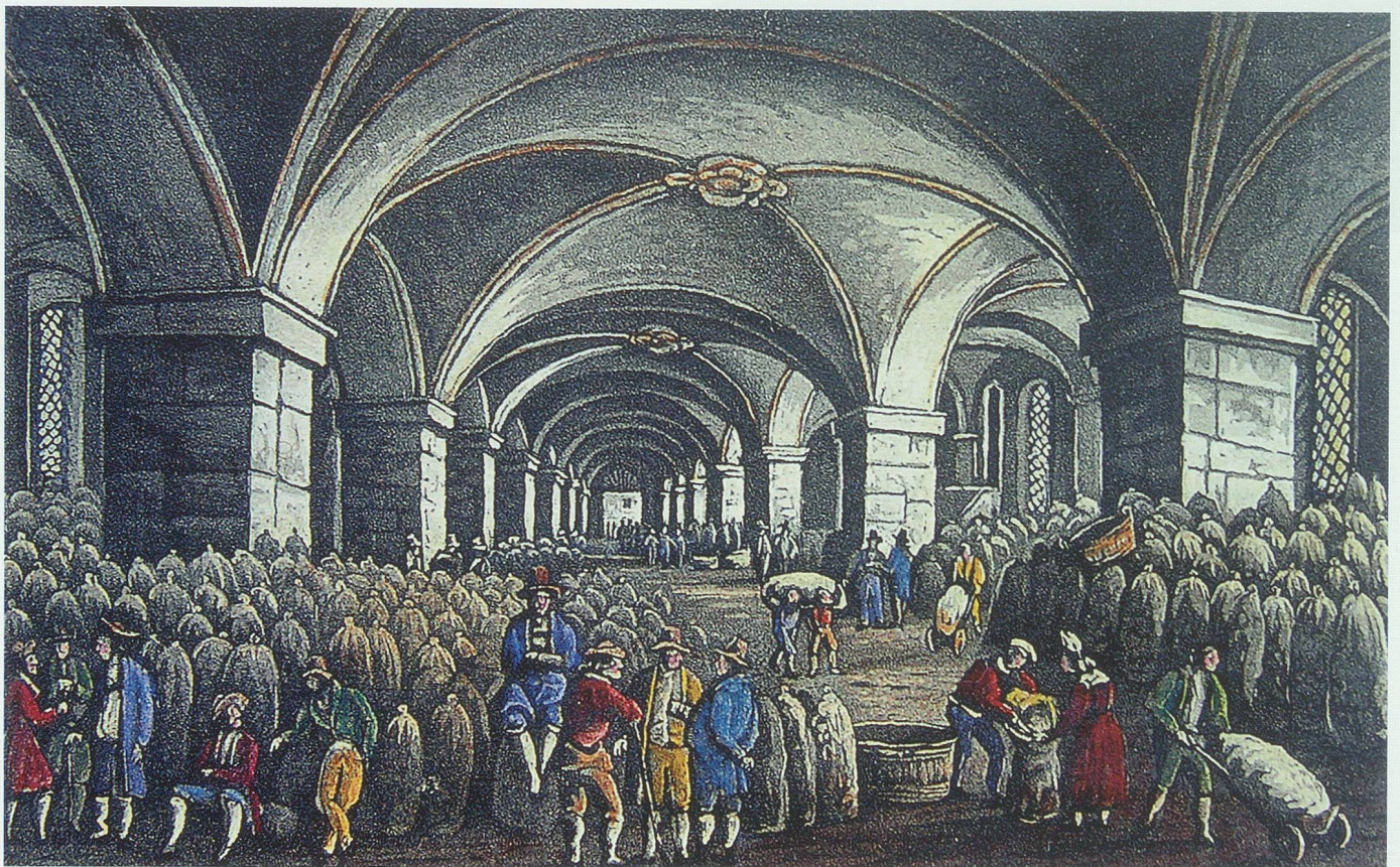
Schon 1748 hatte Abt Coelestin das Kornhaus in Rorschach erbauen lassen, um für die Vorratshaltung Platz zu schaffen. Aquatinta von Johann Baptist Isenring um 1835. Bild aus Bäumann 2003

In etlichen Gegenden herrschte die Not fürchterlich, die Leute wurden vor Hunger schwarz und mager; sie hatten keine Kraft mehr zum Arbeiten und nährten sich mit Nesseln und Heu. Die allgemeine Entkräftung, die die Betroffenen zunehmend apathisch werden liess und in manchen Fällen – oft sogar