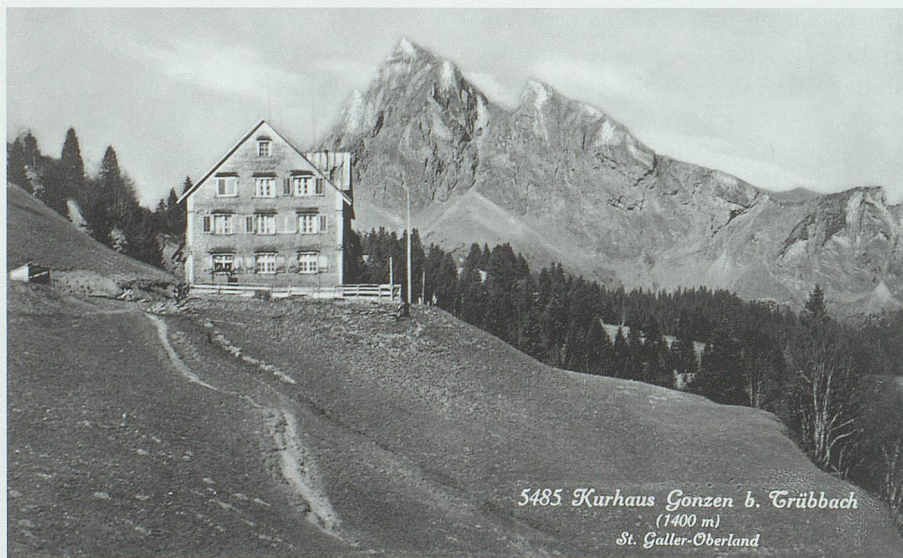
Das Kurhaus Gonzen (hier um etwa 1940) auf 1400 m ü. M. wurde vor dem Brand im Februar 1953 seit 1943 ganzjährig bewohnt. Postkarte in der Bilddatenbank der Gemeinde Wartau