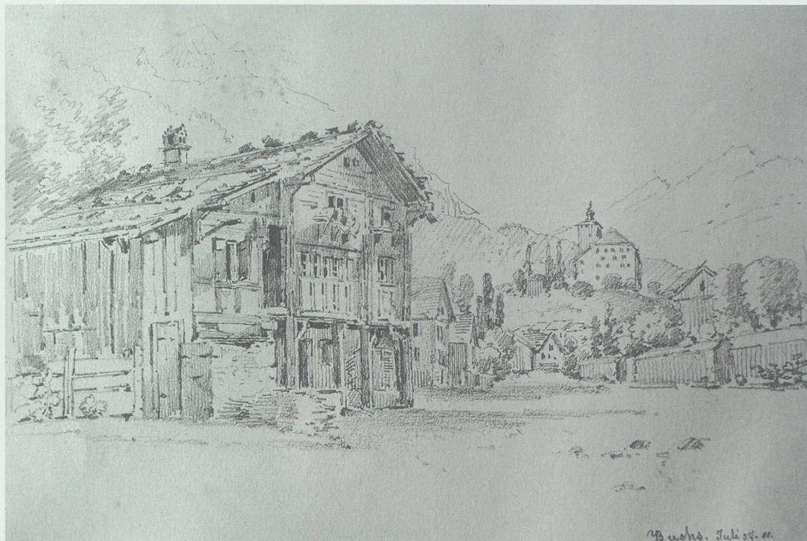
Die 1840 begradigte Landstrasse, die nachmalige St.Gallerstrasse: Auch 18 Jahre nach dem Unglück sind noch nicht alle Häuser mit Ziegeln bedeckt. Zeichnung von Johann Jacob Rietmann, Juli 1857. In Privatbesitz

sern, ebenso die Vorschrift, dass rechteckige Grundstücke mit den Schmalseiten an parallele Strassenzüge zu stossen hatten. Laut Artikel 3 durften Wohnhäuser nur an der Hauptstrasse, nach Artikel 4 Ökonomiegebäude nur auf der der Strasse abgewandten Seite erstellt werden. Der Artikel 5 besagte, dass alle Wohngebäude ein Erdgeschoss von wenigstens 8 Fuss Höhe in solidem Mauerwerk erhalten mussten. Die darüber liegenden Stockwerke durften als Riegel- oder als Strickbau erstellt, alle Dächer hingegen mussten mit Ziegeln oder Schieferplatten eingedeckt werden.