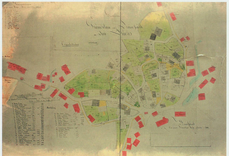
Der nicht mehr auffindbare «Grundplan mit Brandstätte im Dorfe Buchs» von 1839.

Den schnell auf den Platz gebrachten zwei eigenen Feuerspritzen fehlten zuerst die Löscheimer; auch musste jeder Anwesende an die Rettung des eigenen Besitzes denken. Daher stand bald die ganze links der Strasse gelegene Häuserreihe in Flammen, von der Kirche bis zum Posthaus zum 'Hirschen' [...]. Plötzlich drehte der Wind und warf das Feuer auf die schindelgedeckten Häuschen nördlich der Strasse. Jetzt musste man das schon brennende Quartier preisgeben, um den obern und untern Teil des Dorfes und die Kirche retten zu können, die zweimal in grosser Gefahr stand, da zwei zunächst stehende Ge-