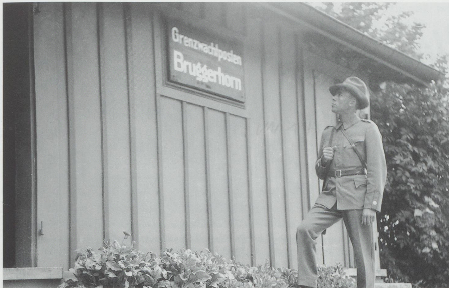
Ausser dem eigentlichen Zollamt St. Margrethen bestanden auch Nebenzollämter (zum Beispiel Monstein-Au) sowie Grenzwachposten wie in Bruggernhorn. Aufnahme nach 1937. Bild bei der Zollkreisdirektion Schaffhausen.