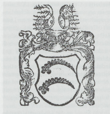
Wappen der «Edelleüt, genennt die von Fontenaub» aus der Schweizer Chronik des Johannes Stumpf von 1586 («Das zähend Buoch», S. DXCVI).