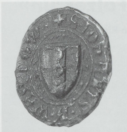
Abb. 7. Siegel der Urkunde vom 15. Oktober 1398, Hans (der Ältere) von Wartau: +S.IOHANIS.D.WARTOW. Im Stiftsarchiv Pfäfers, St.Gallen.