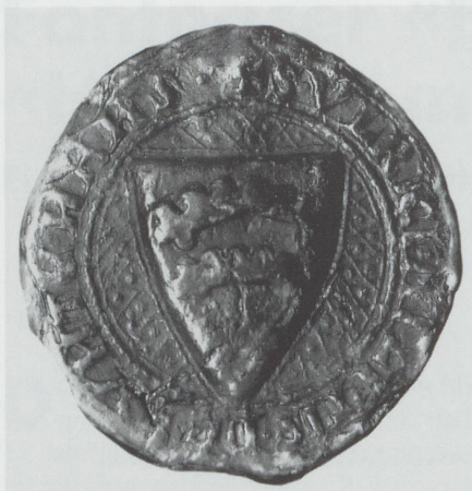
Abb. 3. Siegel der Urkunde vom 16. Oktober 1318, Ulrich (II.) von Fontnas: +S.VLRICI.MILITIS.DE.FVNTVNANS. Im Stadtarchiv Dornbirn.