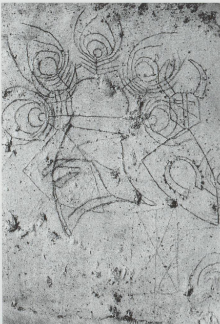
Abb. 1. Ritzzeichnung Burg Fracstein (Kreis Seewis im Prättigau): Wappen von Fontnas und Streiff. Im Rätischen Museum, Chur.