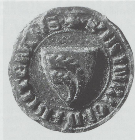
Abb. 4. Siegel der Urkunde vom 3. Februar 1351, Heinrich (III.) von Fontnas: +.S'H[A]INRICI.D.FVNTEN[A]NS. Im Stiftsarchiv Pfäfers, St.Gallen.

Domkapitel und einmal bei einer Schenkung an das Kloster St.Luzi in Chur.