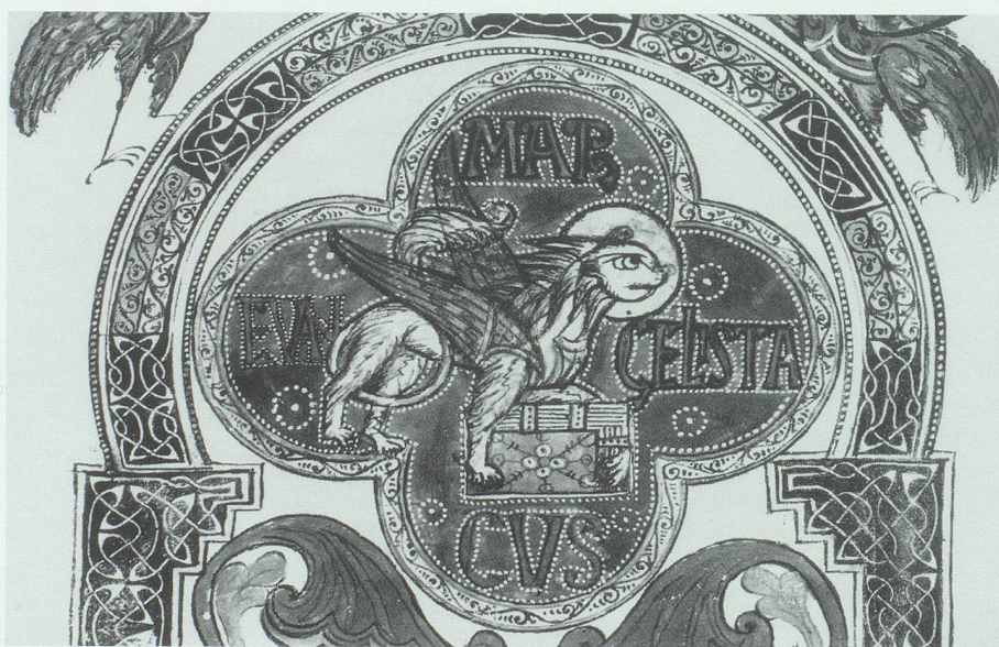
Aus dem Liber Viventium (Faksimiledruck): Löwe, Symbol des Evangelisten Markus.

An erster Stelle steht der um 800 angelegte Liber Viventium , das Buch der Lebenden. Diese Handschrift bezeugt die weite kulturelle Ausstrahlung der Abtei und des Skriptoriums der Abtei Pfäfers in karolingischer Zeit. Die Handschrift diente zunächst liturgischen Zwecken. In ihrer reichen künstlerischen Ausstattung gehört sie zu den bedeutendsten und wohl auch interessantesten noch erhaltenen Erzeugnissen karolingischer Buchmalerei. Die bildlichen Darstellungen wirken unmittelbarer und sind besser erhalten als manche restaurierte Zeugnisse aus jener Zeit. Inhaltlich und formal ist das Buch –