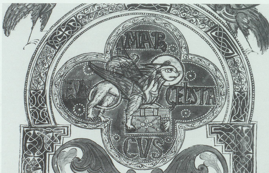
Aus dem Liber Viventium (Faksimiledruck): Löwe, Symbol des Evangelisten Markus.

An erster Stelle steht der um 800 angelegte Liber Viventium , das Buch der Lebenden. Diese Handschrift bezeugt die weite kulturelle Ausstrahlung der Abtei und des Skriptoriums der Abtei Pfäfers in karolingischer Zeit. Die Handschrift diente zunächst liturgischen Zwecken. In ihrer reichen künstlerischen Ausstattung gehört sie zu den bedeutendsten und wohl auch interessantesten noch erhaltenen Erzeugnissen karolingischer Buchmalerei. Die bildlichen Darstellungen wirken unmittelbar und sind besser erhalten als manche restaurierte Zeugnisse aus jener Zeit. Inhaltlich und formal ist das Buch –