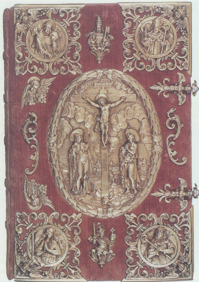
Bild links: Prunkinitialen aus dem Liber Aureus aus dem späten 11. Jahrhundert (Folium 9r.). Bild rechts: Der Pracht-einband des Liber Aureus. Hervorragende Arbeit der Goldschmiedekunst; sie gehört zu den bedeutendsten in der Schweiz erhaltenen Goldschmiedearbeiten der Spätrenaissance.

das erste Werk von geistesgeschichtlicher Bedeutung aus dem Sarganserland – ein äusserst vielgestaltiges Dokument, das trotzdem als beeindruckende Einheit, als Gesamtkunstwerk, bezeichnet werden kann. Es ist «für das Verständnis des Frühmittelalters von höchstem geschichtlichem Interesse». 11