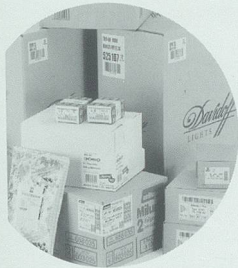
Pago Etiketten für Warenfluss und Logistik