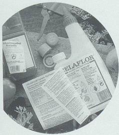
Pago Etiketten für Information am Produkt