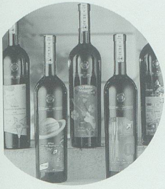
Pago Etiketten für das Verpackungsdesign