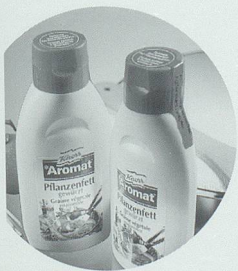
Pago Etiketten für viele Funktionen