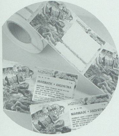
Pago Etiketten für die Produktkennzeichnung